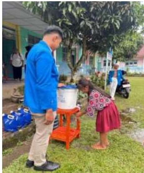
Gambar 3. Pelatihan Cuci Tangan Menggunakan Alat Cuci Tangan Portable