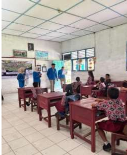
Gambar 2. Edukasi ISPA dan Penerapan PHBS