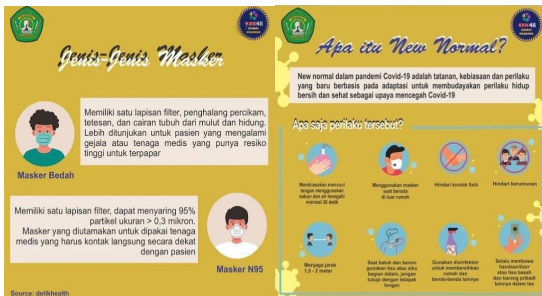
Gambar 3. Foto Bukti Pelaksanaan Langkah 2

Langkah kedua yaitu memberikan edukasi terkait jenis-jenis masker, cara menggunakan masker dan adaptasi kebiasaan baru New Normal yang di sampaikan melalui bentuk poster. Program Kerja ini dilaksanakan melalui sosial media atau daring dengan membagikan poster yang berisi edukasi masker kepada pihak dan masyarakat setempat. Adapun contoh media yang digunakan pada langkah kedua ini seperti pada Gambar 3 berikut.