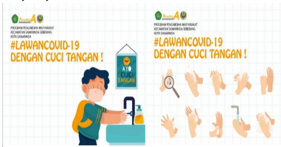
Gambar 2. Foto Bukti Pelaksanaan Langkah 1

Selain itu, berdasarkan hasil kuesioner setelah menonton video sebanyak 83,3% responden tahu bagaimana cara mencuci tangan yang baik dan benar sesuai standar WHO. Sehingga dapat disimpulkan bahwa evaluasi dari kegiatan langkah pertama ini berhasil karena adanya peningkatan pemahaman di masyarakat mengenai bagaimana mencuci tangan sesuai standar WHO. Adapun media yang digunakan pada kegiatan pertama seperti pada Gambar 2 berikut.