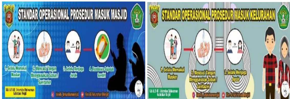
Gambar 5. Penampakan Spanduk SOP dan Protokol Kesehatan serta perizinan

kegiatan ini melalui pertemuan dengan Kelurahan Masjid untuk mendesain spanduk. Dalam langkah ini kami berhasil mendesain 3 spanduk yang akan dipasang di Kelurahan Masjid. Adapun desain spanduk yang dibuat seperti pada Gambar 5 berikut.