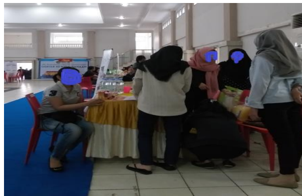
Gambar 4. Pengemasan masker

Metode yang ketiga kami menerima barang pesanan yang akan dibagikan ke masyarakat Kelurahan Mesjid. Barang yang kami terima dalam keadaan baik. Selanjutnya kami langsung mengemas masker dan faceshield ke dalam plastik. Pengemasan masker dan faceshield berlangsung seperti pada Gambar 4 berikut.