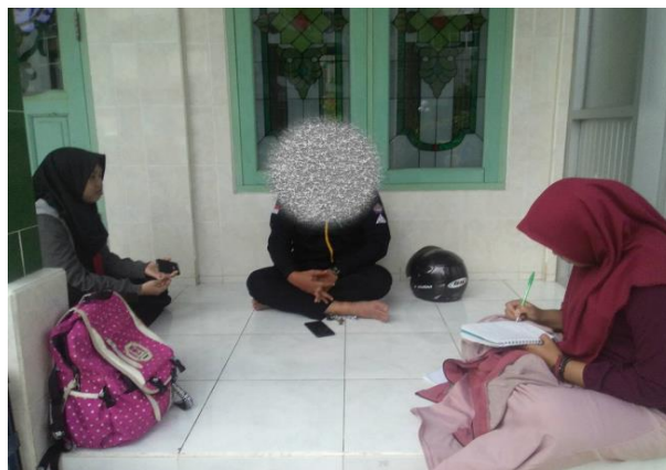
Gambar 2. Penggalian data awal

Metode yang pertama kali kami lakukan adalah mencari informasi melalui pihak kelurahan mengenai masyarakat yang ada di kelurahan mesjid. Pencarian informasi ini bertujuan untuk mengetahui tentang hal apa saja yang bisa kami lakukan untuk mengatasi keadaan dan kesulitan yang terjadi di kelurahan Mesjid. Informasi yang disampaikan pendamping lapangan mengenai masyarakat yang ada di kelurahan mesjid adalah masih banyak masyarakat yang acuh seperti lalai dalam memakai masker, jarang mencuci tangan pada saat keluar dari rumah, warga masih sering berkerumun, dan tidak menjaga jarak satu sama lain. Proses penggalian data awal ini berlangsung seperti pada Gambar 2 berikut.