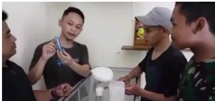
Gambar 1. Survey Usaha