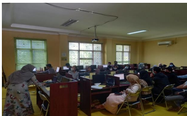
Gambar 4. Proses Simulasi Software

Acara dilanjutkan dengan sesi kedua yaitu penyampaian materi tentang tutorial penggunaan perangkat lunak dalam mempersiapkan data dan membuat model serta mengolah data dengan SmartPLS. Tutorial ini dilakukan dimana semua peserta mempunyai komputer masing masing di meja dengan perangkat lunak SmartPLS 3 terpasang seperti pada Gambar 4 berikut.