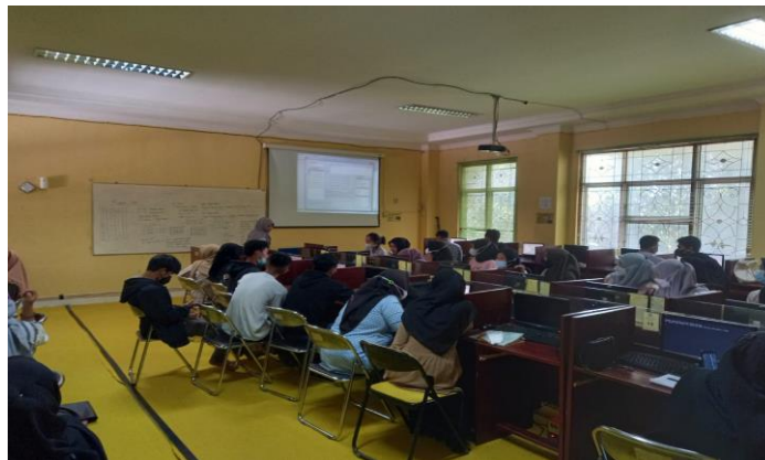
Gambar 2. Penyampaian Pengenalan Software SmartPLS

Tahap pelaksanaan kegiatan dan pendampingan kepada para peserta dalam praktik mengolah data penelitian tugas akhir dengan SmartPLS dibagi beberapa sesi. Pada presentasi di sesi pertama, narasumber menyampaikan beberapa materi tentang konsep dasar statistika yang diperlukan untuk SEM. Konsep dasar statistika tersebut berfokus pada materi-materi dasar seperti regresi, analisis faktor, variabel laten, kekuatan hubungan dan variabilitas (Matdoan et al., 2021). Penyampaian materi pada sesi pertama berlangsung seperti pada Gambar 2 berikut.