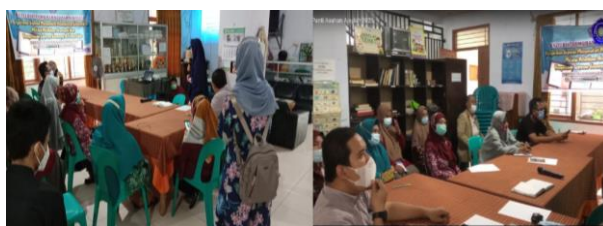
Gambar 3. Kegiatan Pelatihan Akuntansi

Pelaksanaan kegiatan PKM dilakukan pada tanggal 12 Juni 2021 di Aula Panti Asuhan Bahagia Aisyiyah Makassar. Materi yang disampaikan dalam pelatihan adalah mengenai cara mengidentifikasi, mengelompokkan, dan meringkas transaksi yang terjadi berkaitan dengan penerimaan bantuan dari donatur, serta pelatihan mengenai cara menyusun laporan keuangan berdasarkan transaksi yang sudah diuraikan. Kegiatan pelatihan dihadiri oleh 20 orang peserta baik dari pengelola maupun anak panti yang selama ini membantu dalam proses administrasi di panti asuhan Bahagia Aisyiyah Makassar. Peserta pelatihan akuntansi serius dan antusias mengikuti kegiatan, dan pada saat sesi tanya jawab beberapa pengelola mengajukan pertanyaan terutama pada proses pencatatan akuntansi dan penyusunan laporan keuangan berdasarkan PSAK No.45, karena selama ini pencatatan yang dilakukan masih sangat sederhana meskipun sudah menggunakan alat bantu komputer. Pelatihan ini berlangsung seperti pada Gambar 3 berikut.