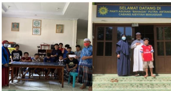
Gambar 2. Survey dan Sosialisasi