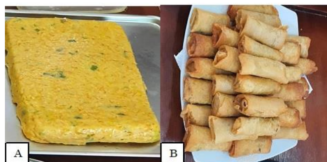
Gambar 4. Isian lumpia udang (A), lumpia udang setelah digoreng (B)

Bahan-bahan yang digunakan terdiri dari daging udang, tepung tapioka, tepung terigu, telur, margarin, wortel, daun bawang, kulit lumpia, dan bumbu-bumbu yang terdiri dari garam, gula, bawang putih, bawang bombay, merica, dan kaldu bubuk. Hal penting yang diajarkan pada peserta pelatihan adalah bagaimana membentuk tekstur yang kenyal dan lembut pada isian lumpia tanpa penambahan bahan pengenyal. Kuncinya terletak pada urutan penambahan bumbu dan pengadonan. Tekstur yang kenyal dan lembut dapat diperoleh dengan homogenisasi daging udang dengan air es garam terlebih dahulu, baru diikuti penambahan bumbu dan bahan-bahan lain. Prinsip ini sesuai dengan pembentukan gel surimi, penambahan garam akan melarutkan protein miofibril sehingga mempermudah terbentuknya struktur 3 dimensi gel protein dengan memerangkap air (Van Phu et al. , 2010). Isian lumpia udang dan lumpia setelah digoreng dapat dilihat pada Gambar 4.