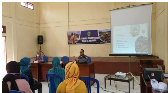
Gambar 2. Penyampaian materi pentingnya kesegaran udang dan hasil samping, cara penanganannya, dan bahaya limbah udang.