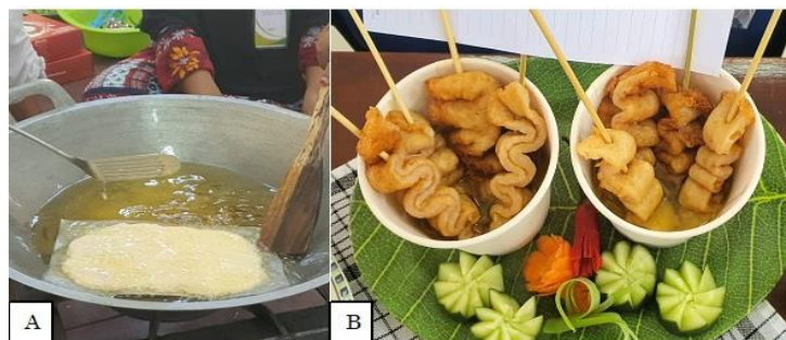
Gambar 5. Penggorengan adonan shrimp cake (A), penyajian shrimp cake atau odeng (B).

Bahan-bahan yang digunakan dalam pembuatan shrimp cake terdiri dari daging udang, putih telur, tepung tapioka, baking powder, air es, garam, gula, bawang putih, bawang bombay, merica, dan kaldu bubuk. Homogenisasi daging udang dan air es garam dapat dilakukan menggunakan tangan. Setelah tekstur daging lumpat menjadi lengket dan menyatu dengan air es garam, baru ditambahkan putih telur, bumbu-bumbu sambil terus diaduk sampai homogen. Tepung tapioka ditambahkan paling terakhir sedikit demi sedikit sambil adonan terus diaduk. Adonan shrimp cake kemudian diratakan pada baking paper dan digoreng dengan api sedang sampai kuning kecokelatan. Baking paper akan terlepas dengan sendirinya saat penggorengan. Penyajian shrimp cake dibuat mirip dengan “odeng” yaitu ditusuk dengan tusuk sate dan disajikan dengan kuah sup. Penggorengan adonan shrimp cake dan “odeng” yang telah matang disajikan pada Gambar 5.