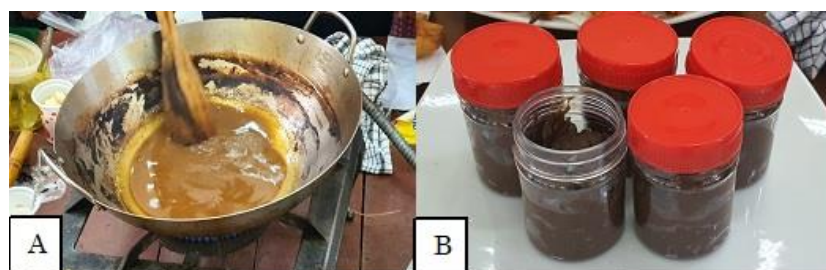
Gambar 3. Perebusan kaldu udang (A), petis udang (B)

Kelebihan penggunaan bahan pengisi adalah mempersingkat waktu perebusan, tingkat kekentalan petis dapat diatur, petis yang diperoleh lebih banyak, sedangkan kekurangannya adalah flavor khas petis yang kuat belum terbentuk karena waktu perebusan yang belum lama, dan rasa serta aroma khas udang sedikit tertutupi tergantung banyak sedikitnya bahan pengisi yang digunakan. Flavor khas petis udang yaitu rasa udang yang kuat disertai aroma khas reaksi pencoklatan akan terbentuk ketika kaldu udang direbus dalam waktu yang lama sekitar 10 sampai 12 jam. Reaksi pencoklatan yang terjadi diduga berupa reaksi karamelisasi dan maillard. Reaksi karamelisasi terjadi karena adanya gula dalam petis yang dipanaskan dalam waktu lama, sedangkan reaksi maillard terjadi karena adanya protein dan gula pereduksi (glukosa atau fruktosa) serta adanya panas (Kuncoro et al. , 2019). Kedua reaksi tersebut menghasilkan warna coklat pada petis dan flavor yang khas. Oleh karena itu, penggunaan bahan pengisi bersifat opsional dan diserahkan pada pilihan peserta jika nanti akan membuat petis setelah pelatihan. Proses perebusan kaldu udang dan petis udang yang dihasilkan dapat dilihat pada Gambar 3.