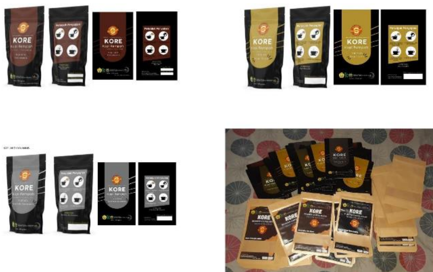
Gambar 6. Inovasi packaging KORE