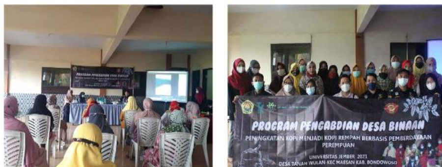
Gambar 3. Kegiatan Sosialisasi

Koordinator Klinik Ekspor Beacukai Jember menyampaikan berbagai contoh kesuksesan ekspor kopi pada komunitas petani di daerah lain. Misalnya komunitas petani di wilayah Aceh yang berhasil mengekspor produk kopi hingga ke manca negara yakni sebanyak 1.065 ton biji kopi arabika gayo pada tahun 2017. Tujuan ekspor kopi gayo antara lain ke Amerika Serikat, Australia, Kanada dan Jerman (Afriamah et al., 2021). Pada masa mendatang, prospek kopi arabika akan semakin menjanjikan karena permintaan global yang semakin meningkat (Alqarni et al., 2020). Berikut dokumentasi kegiatan, seperti terlihat pada Gambar 3.