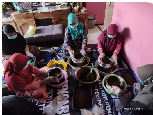
Gambar 4. Kegiatan Produksi KORE

Pada kegiatan ini, komunitas perempuan Desa Tanah Wulan melakukan produksi KORE baik mulai dari persiapan rempah, penyangraian biji kopi, penggilingan biji sangrai, pengayakan kopi bubuk dan formulasi masing-masing varian kopi yakni kopi original, kopi jahe merah, kopi jahe merah dan kapulaga serta kopi jahe merah, kapulaga dan kayu manis. Setiap individu telah menguasai tahapan-tahapan pengolahan KORE sesuai dengan job description masing-masing, seperti terlihat pada Gambar 4.