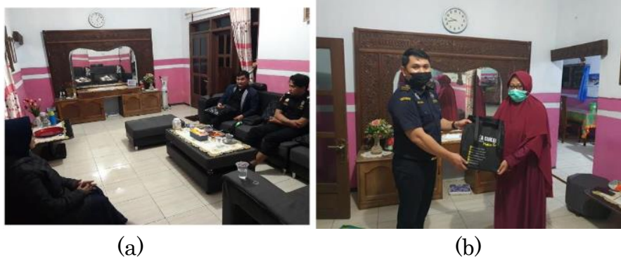
Gambar 2. Diskusi KORE dan Peluang Ekspor (a) Diskusi Pertama (b) Diskusi Kedua

Berdasarkan usaha produksi dan penjualan KORE yang telah kami lakukan sejak tahun 2019, nilai jual kopi robusta yang diproduksi Desa Tanah Wulan dapat memperoleh peningkatan. Selain itu, perempuan di Desa Tanah Wulan juga telah berdaya melalui kegiatan produksi KORE. Pemasaran KORE telah sampai ke Kantor Bea Cukai Jember dan mendapatkan apresiasi yang baik dari Koordinator Klinik Ekspor Bea Cukai (Kepala KPPBC TMP C Jember). Kami menyambung diskusi dan dilakukan pertemuan untuk membicarakan potensi ini yaitu sebanyak dua kali. Dokumentasi pertemuan ini disajikan pada Gambar 2. Terdapat potensi besar KORE bisa diekspor dan beliau siap mendukung dan mentraining kami hingga bisa melaksanakan ekspor. Ada beberapa langkah untuk persiapan ekspor yaitu membentuk koperasi yang berbadan hukum, sertifikasi, dan sebagainya, seperti terlihat pada Gambar 2.