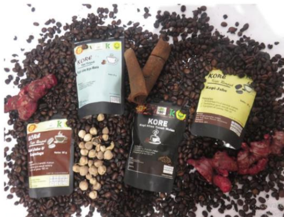
Gambar 5. Varian produk KORE

Adanya kerjasama dengan toko oleh-oleh tersebut meningkatkan jumlah produk KORE yang terjual hingga 50%, disamping penjualan secara langsung maupun menggunakan media sosial dan online market, seperti terlihat pada Gambar 5 dan Gambar 6.