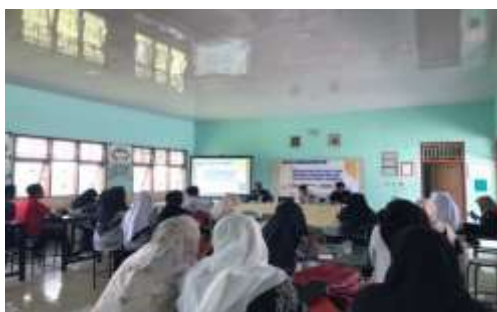
Gambar 3. Pelatihan sesi 1 pemaparan materi

Setelah para peserta mendapatkan materi melalui modul dan membaca secara mandiri, selanjutnya dilakukan pelatihan sesi 1 yang dilakukan dengan metode ceramah, demonstrasi, dan diskusi. Pada tahap ini diorientasikan pada pemaparan materi dengan ppt yang berisi penjelasan definisi, konsep dasar, prinsip karya ilmiah dan fungsinya, serta memberikan beberapa contoh dengan demonstrasi.