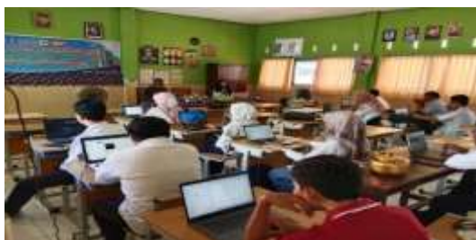
Gambar 4. Pelatihan sesi 2 Praktek Penulisan Artikel Ilmiah, pembimbingan, pendampingan, dan refleksi.

Pada tahap pelatihan sesi 2 ini diorientasikan pada implementasi secara praktis. Adapun kegiatan yang dilakukan para guru adalah melakukan latihan pengetikan draf artikel yang sesuai dengan template suatu jurnal yang mengandung abstrak, pendahuluan, dan metodologi, sedangkan untuk penulisan hasil dan pembahasan dan bagian akhir diselesaikan dalam kegiatan pendampingan oleh Dosen dan mahasiswa yang menjadi tim pengabdian.