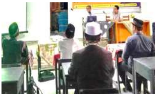
Gambar 2. Kegiatan Sosialisasi.

Untuk efisiensi, maka pada tanggal 12 September 2024 dilakukan sosialisasi dengan kegiatan pembagian materi dalam bentuk modul dan power point sebagai orientasi awal atas kegiatan, hal ini menurut Zulkarnain et al. 2023; dan Isnaini, dkk, 2021) sangat mempermudah para guru dalam memahami arah kegiatan.