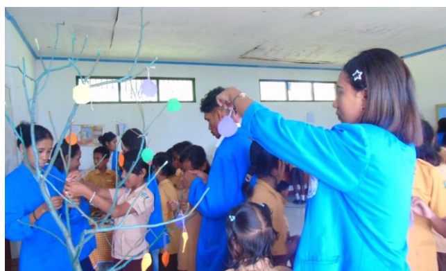
Gambar 5: Pembuatan Pohon Iman bersama peserta kegiatan

Kegiatan pembinaan ini diselingi dengan nyanyi dan animasi bersama. Peserta didik SDK Pantai Besar sangat antusias dalam mengikuti kegiatan ini. Ketika mahasiswa kelompok PkM memberikan pertanyaan, peserta didik saling berebutan untuk menjawab pertanyaan tersebut. Hal ini dilakukan untuk mengasah kemampuan berpikir mereka tentang karakter religius dalam kehidupan sehari-hari. Selain itu, tim PkM memberikan penugahan kepada peserta didik agar iman karakter religius mereka tetap kuat dalam menghadapi perkembangan teknologi di era digital ini. Selanjutnya, tim PkM mengajak peserta didik secara kolektif untuk membuat pohon iman. Setiap peserta didik diminta untuk menuliskan beberapa kalimat maupun motto tentang karakter religius dan penggunaan teknologi untuk hal yang positif. Peserta kegiatan PKM sangat aktif dalam melakukan hal tersebut. Setelah itu, setiap peserta didik bertanggung jawab sampai dengan penggantungan tulisan yang dibuat. Tulisan di kertas tersebut, dilubangi dan diikat dengan benang wol. Selanjutnya, setiap peserta didik mendapatkan kesempatan untuk menggantungkan tulisan tersebut di pohon iman. Tim PkM mengawasi dan memberikan petunjuk untuk menulis sesuai dengan nilai-nilai karakter religius dalam menghadapi tantangan di era digital ini seperti menggunakan Hp sebagai media untuk mengerjakan tugas, mengandalkan Tuhan dalam setiap perjuangan hidup, hidup sesuai dengan nilai ajaran agama, bersikap sesuai ajaran Tuhan dan lain sebagainya.