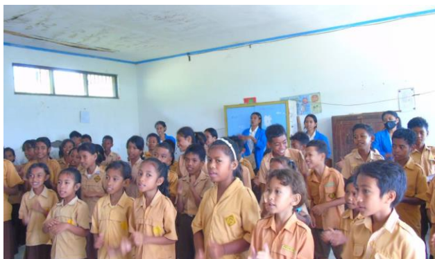
Gambar 3. Kegiatan Animasi Bersama Peserta

Setelah selesai doa bersama, sebelum memberikan materi diawali dengan bernyanyi dan animasi bersama. Kegiatan animasi dan bernyanyi bersama dibuat guna untuk menambahkan semangat bagi peserta didik agar mereka tidak jenuh pada saat mendengarkan materi yang diberikan (Soepomo, 2017). Selain itu, dengan animasi dan bernyanyi bersama dapat mengibur peserta didik SDK Pantai Besar. Animasi dan bernyanyi bersama tidak hanya terjadi diawal sebelum memberikan materi pembinaan tetapi dibagian pertengahan dan juga di bagian akhir. Kegiatan ini dapat membangun komunitas dan merajut kebersamaan yang baik diantara mereka. Selain itu, peserta didik SDK Pantai Besar dapat mengimplementasikan nilai-nilai yang baik dari setiap animasi dan lagu yang dinyanyikan. Peserta didik sangat semangat dan gembira pada saat menyanyi dan animasi bersama.