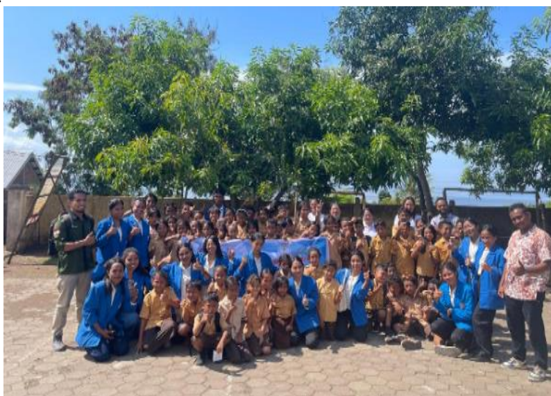
Gambar 6: Foto Bersama

Tim PkM juga mengajak peserta didik di SDK Pantai Besar untuk menggunakan Hp dengan sebaik mungkin, tidak mudah terpengaruh dengan konten-konten yang lancar, selalu berdoa kepada Tuhan, terlibat aktif dalam kegiatan menggereja, dan selalu mengandalkan Tuhan dalam setiap perjalanan hidup (Bela & Mahmudah, (2024).. Kegiatan pendampingan ini berjalan dengan lancar dan diharapkan agar peserta didik di SDK Pantai Besar mampu menguatkan karakter religius dalam menghadapi tantangan di era digital. Selain itu, kegiatan ini dapat memberikan edukasi tentang karakter religius peserta didik agar tumbuh menjadi generasi yang tidak hanya pandai dalam menguasai teknologi tetapi mampu mempertahankan karakter religius yang berakhlak mulia dalam menghadapi tantangan di era digital. Dengan demikian, para peserta didik dapat menjadi tongkat estafet bagi teman-teman, orang tua, para guru maupun masyarakat yang akan mereka jumpai serta memberikan diri secara total kepada Tuhan.