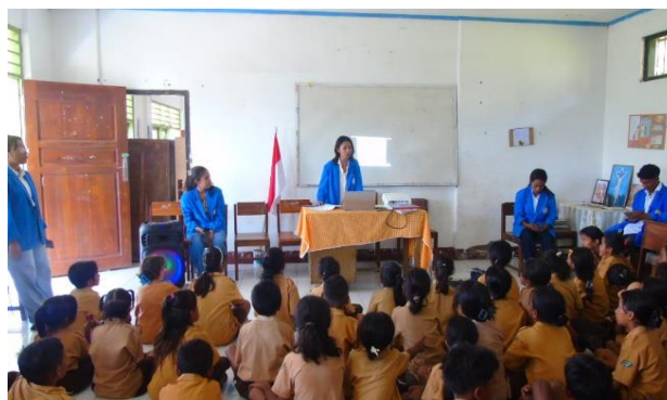
Gambar 4: Pemberian Materi yang di lakukan oleh kelompok PkM

Kegiatan pembinaan ini diselingi dengan nyanyi dan animasi bersama. Peserta didik SDK Pantai Besar sangat antusias dalam mengikuti kegiatan ini. Ketika mahasiswa kelompok PkM memberikan pertanyaan, peserta didik saling berebutan untuk menjawab pertanyaan tersebut. Hal ini dilakukan untuk mengasah kemampuan berpikir mereka tentang karakter religius dalam kehidupan sehari-hari. Selain itu, tim PkM memberikan penugahan kepada peserta didik agar iman karakter religius mereka tetap kuat dalam menghadapi perkembangan teknologi di era digital ini. Selanjutnya, tim PkM mengajak peserta didik secara kolektif untuk membuat pohon iman. Setiap peserta didik diminta untuk menuliskan beberapa kalimat maupun motto tentang karakter religius dan penggunaan teknologi untuk hal yang positif. Peserta kegiatan PKM sangat aktif dalam melakukan hal tersebut. Setelah itu, setiap peserta didik bertanggung jawab sampai dengan penggantungan tulisan yang dibuat. Tulisan di kertas tersebut, dilubangi dan diikat dengan benang wol. Selanjutnya, setiap peserta didik mendapatkan kesempatan untuk menggantungkan tulisan tersebut di pohon iman. Tim PkM mengawasi dan memberikan petunjuk untuk menulis sesuai dengan nilai-nilai karakter religius dalam menghadapi tantangan di era digital ini seperti menggunakan Hp sebagai media untuk mengerjakan tugas, mengandalkan Tuhan dalam setiap perjuangan hidup, hidup sesuai dengan nilai ajaran agama, bersikap sesuai ajaran Tuhan dan lain sebagainya.