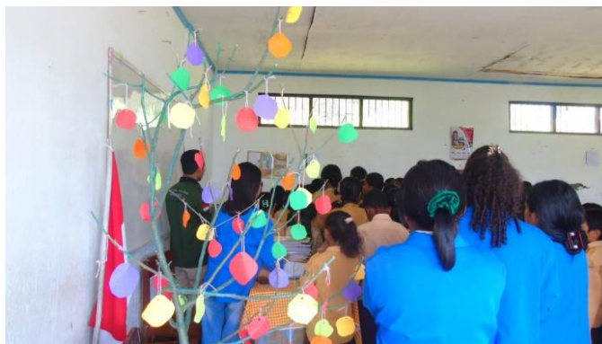
Gambar 2: Peserta Kegiatan dan Tim PkM Melakukan Doa Bersama

Doa pembuka dipimpin oleh salah satu tim PkM. Kegiatan ini bertujuan untuk mengajak para peserta kegiatan untuk terlibat dalam doa dan memberikan pengetahuan tentang bagaimana sikap doa yang benar di hadapan Tuhan. Kegiatan doa ini terjadi di dalam ruang kelas SDK Pantai Besar. Berkaitan dengan doa, hal ini menjadi suatu kewajiban yang sangat penting agar dapat memberikan kesadaran kepada peserta didik untuk selalu mengucap Syukur kepada Tuhan. Dengan terlaksananya kegiatan ini, dapat membantu peserta didik SDK Pantai Besar untuk lebih dekat dan mengandalkan Tuhan dalam kehidupan sehari-hari. Harapan dari kegiatan doa bersama ini agar peserta didik dapat mengimplementasikan dalam perjalanan hidup mereka.