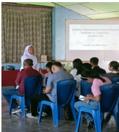
Gambar 3: Refleksi diri dan Komitmen

Pendekatan teologis-pastoral yang digunakan menekankan bahwa kesiapan menerima sakramen perkawinan tidak hanya berupa pemahaman teoretis, melainkan sikap iman yang matang dan terbuka terhadap karya Allah. Amoris Laetitia (Fransiskus, 2016) menegaskan bahwa kasih sejati dalam perkawinan bertumbuh melalui pengalaman saling memahami, mengampuni, dan mendukung. Sesi ini membantu peserta menghayati makna kesetiaan sebagai panggilan rohani, bukan sekadar janji formal.