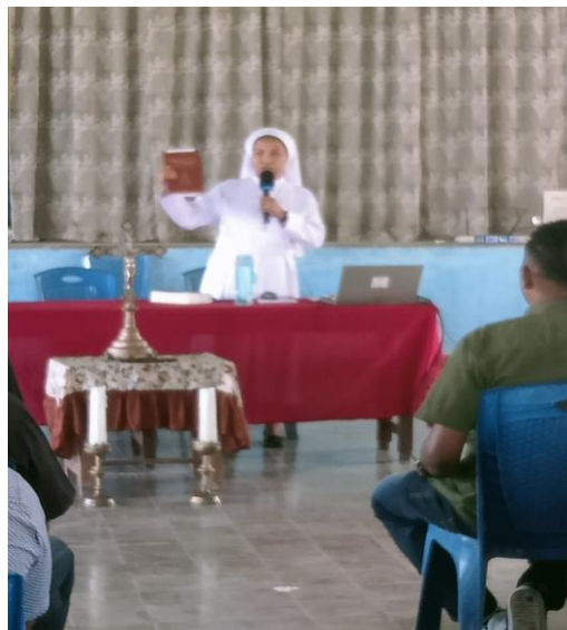
Gambar 1: Penjelasan tentang Perkawinan dalam Gereja Katolik

bahwa perkawinan adalah panggilan suci yang melibatkan pertumbuhan iman bersama, serta persekutuan kasih yang mencerminkan relasi antara Kristus dan Gereja. Perubahan cara pandang peserta terhadap perkawinan, yang semula dianggap sebagai urusan pribadi kini dipahami sebagai perutusan iman dalam kasih dan kesetiaan (Yohanes Paulus II, 1981).