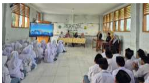
Gambar 1. Pelaksanaan Workshop Participatory Planning

Kegiatan diawali dengan penyamaan persepsi mengenai urgensi literasi keagamaan dalam pembelajaran PAI. Pada sesi ini, tim PKM memfasilitasi diskusi terbuka terkait hasil identifikasi kebutuhan yang telah dilakukan sebelumnya, termasuk temuan observasi kelas dan hasil pre-test siswa. Guru diberikan kesempatan untuk merefleksikan praktik pembelajaran yang selama ini berjalan serta mengemukakan tantangan yang dihadapi dalam mengembangkan pembelajaran yang lebih kontekstual dan dialogis. Diskusi ini menjadi landasan bersama untuk merumuskan arah pengembangan perangkat pembelajaran.