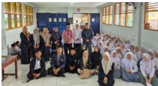
Gambar 2. Akhir Kegiatan Workshop Participatory Planning

Pada akhir kegiatan, dilakukan refleksi bersama untuk mengevaluasi proses workshop. Guru menyampaikan bahwa pendekatan partisipatif membantu mereka memahami secara lebih konkret bagaimana literasi keagamaan dapat diintegrasikan dalam pembelajaran PAI. Selain menghasilkan perangkat pembelajaran yang lebih sistematis dan kontekstual, workshop ini juga meningkatkan rasa memiliki ( sense of ownership ) guru terhadap produk yang dihasilkan. Dengan demikian, pelaksanaan Workshop Participatory Planning tidak hanya menghasilkan dokumen perangkat pembelajaran, tetapi juga memperkuat kapasitas pedagogis guru dalam mengembangkan pembelajaran PAI berbasis literasi keagamaan secara berkelanjutan.