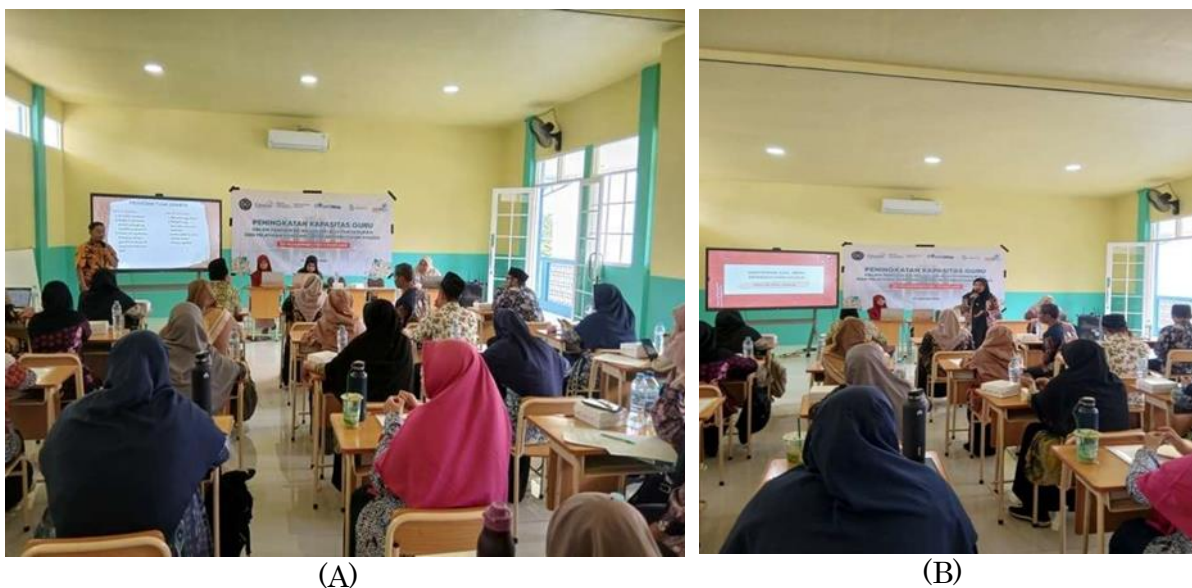
Gambar 2. (A) Penyampaian Materi Ragam Jenis Disabilitas, (B) Penyampaian Materi Pengenalan Alat Identifikasi Siswa Berkebutuhan Khusus

Peningkatan pemahaman tersebut dapat dijelaskan melalui efektivitas pendekatan psikoedukasi yang menekankan integrasi antara pengetahuan teoretis dan refleksi pengalaman (Rasido dkk., 2024). Metode experiential learning yang diterapkan melalui simulasi observasi memungkinkan guru mengembangkan keterampilan analitis dalam mengenali indikator perilaku dan karakteristik siswa. Pendekatan ini selaras dengan temuan bahwa pelatihan berbasis praktik memiliki dampak yang lebih signifikan terhadap penguasaan kompetensi dibandingkan metode ceramah satu arah (Prasasongko & Kuswinarno, 2024). Sesi pengenalan media pembelajaran bagi siswa berkebutuhan khusus dan praktik penggunaan alat screening tergambar pada dokumentasi berikut ini