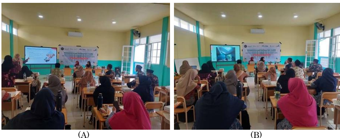
Gambar 3. (A) Penyampaian materi media pembelajaran bagi siswa berkebutuhan khusus, (B) Praktik penerapan alat identifikasi siswa berkebutuhan khusus

Peningkatan pemahaman tersebut dapat dijelaskan melalui efektivitas pendekatan psikoedukasi yang menekankan integrasi antara pengetahuan teoretis dan refleksi pengalaman (Rasido dkk., 2024). Metode experiential learning yang diterapkan melalui simulasi observasi memungkinkan guru mengembangkan keterampilan analitis dalam mengenali indikator perilaku dan karakteristik siswa. Pendekatan ini selaras dengan temuan bahwa pelatihan berbasis praktik memiliki dampak yang lebih signifikan terhadap penguasaan kompetensi dibandingkan metode ceramah satu arah (Prasasongko & Kuswinarno, 2024). Sesi pengenalan media pembelajaran bagi siswa berkebutuhan khusus dan praktik penggunaan alat screening tergambar pada dokumentasi berikut ini