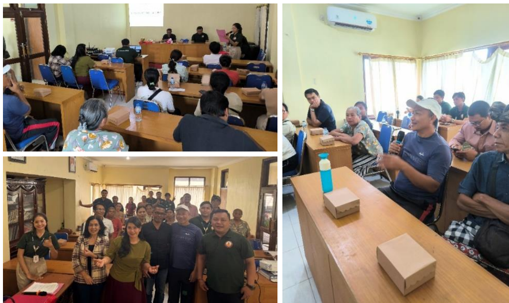
Gambar 1. Antusias Peserta Pendampingan

Secara keseluruhan, integrasi pelatihan inovasi produk, penguatan SDM, dan digitalisasi keuangan terbukti memberikan dampak yang lebih komprehensif dibandingkan pendekatan parsial. Pendekatan kolaboratif antara dosen dan mahasiswa KKN juga meningkatkan efektivitas transfer pengetahuan karena pendampingan dilakukan secara intensif dan kontekstual. Namun demikian, beberapa kendala masih ditemukan, seperti keterbatasan perangkat digital pada sebagian peserta dan perlunya pendampingan berkelanjutan agar implementasi tetap konsisten. Oleh karena itu, keberlanjutan program melalui monitoring lanjutan dan kolaborasi dengan pemerintah desa menjadi rekomendasi penting untuk menjaga dampak jangka panjang kegiatan ini.