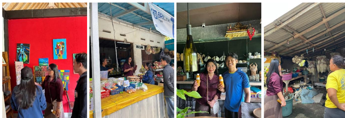
Gambar 1. Kunjungan ke UMKM

Pada tahap pra kegiatan, tim pengabdian melakukan observasi lapangan, wawancara, serta pendataan terhadap pelaku UMKM di Banjar Batulumbang, Desa Bedulu.