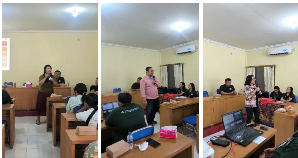
Gambar 2. Kegiatan Edukasi UMKM

Tahap kegiatan inti dilaksanakan melalui serangkaian aktivitas. Program inti berjalan sesuai dengan tahapan yang telah direncanakan, mulai dari kegiatan sosialisasi, workshop inovasi produk, pelatihan pengelolaan SDM, hingga pendampingan implementasi keuangan digital pada masing-masing UMKM. Seluruh rangkaian kegiatan dilaksanakan secara partisipatif dengan melibatkan tim dosen dan mahasiswa KKN, sehingga proses transfer pengetahuan berlangsung interaktif dan aplikatif.