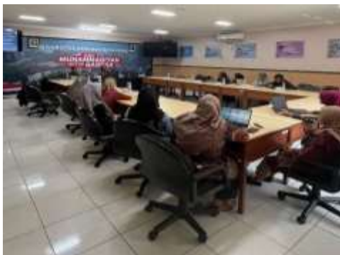
Gambar 4. Proses Kegiatan Pelatihan

Penyampaian materi dasar-dasar puisi bertujuan agar guru memahami unsur-unsur pembangun puisi. Materi unsur pembangun puisi diberikan di awal kegiatan karena pemahaman terhadap unsur puisi berfungsi sebagai elemen teknis dan media ekspresi diri yang mendalam (Rohmah et al., 2024).