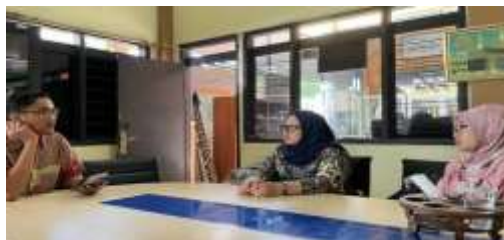
Gambar 2. Sosialisasi dengan Guru Koordinator SD Muhammadiyah 9

Tahap sosialisasi sebagai pra kegiatan bertujuan untuk mengenalkan konsep dan tujuan program kepada seluruh guru SD Muhammadiyah 9 Kota Malang. Tujuan program adalah untuk meningkatkan literasi dan kreativitas guru dalam menulis puisi dengan bantuan AI.