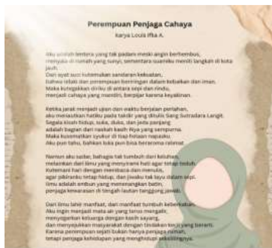
Gambar 6. Hasil Karya Puisi dari Kegiatan Pendampingan dan Evaluasi

Kegiatan pendampingan dan evaluasi menghasilkan karya puisi yang dibuat melalui proses kreatif berbasis AI sekaligus menjadi produk inovasi yang bersifat non-fisik ( soft ). Naskah puisi tersebut merupakan hasil langsung dari kegiatan pendampingan dan evaluasi berkelanjutan. Naskah puisi ini merupakan karya kreatif guru yang dihasilkan melalui proses pembelajaran dan eksplorasi menulis puisi berbasis Model GEN-POEM dengan bantuan teknologi AI. Guru memanfaatkan Poem Generator sebagai alat bantu awal dalam menemukan ide dan diksi, kemudian melakukan penyuntingan dan penambahan sentuhan kreatif personal untuk menjaga orisinalitas karya. Naskah puisi yang dihasilkan mencerminkan peningkatan kapasitas guru dalam menulis puisi, sekaligus menjadi contoh praktik baik ( best practice ) yang dapat dijadikan referensi dalam pembelajaran menulis puisi di kelas. Kumpulan naskah puisi ini juga berpotensi dikembangkan lebih lanjut menjadi antologi atau bahan ajar kontekstual.