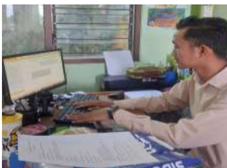
Gambar 5. Penerapan Teknologi Pembuatan Puisi Berbasis AI secara Mandiri

Penerapan teknologi sebagai kegiatan inti merupakan tahap implementasi dari pelatihan. Guru akan mulai mengaplikasikan pengetahuan yang mereka dapatkan untuk menghasilkan karya puisi secara mandiri. Penugasan mandiri dilakukan dengan cara memberikan tugas kepada guru untuk menulis puisi dengan bantuan AI. Penulisan puisi memuat tema-tema yang relevan dengan materi pembelajaran di kelas. Relevansi tersebut berguna sebagai proses tindak lanjut sehingga penulisan puisi berbasis AI dapat digunakan sebagai media pembelajaran.