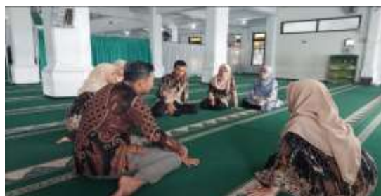
Gambar 3. Proses Diskusi Interaktif pada Tahap Sosialisasi

Kegiatan sosialisasi pada gambar 2 berupa koordinasi yang bertujuan untuk melakukan persiapan yang terdiri atas penyusunan jadwal program dan pembagian tim fasilitator. Pemaparan konsep yang bertujuan untuk menjelaskan latar belakang dan pentingnya program ini untuk meningkatkan kompetensi guru dan inovasi pembelajaran di sekolah. Pengenalan teknologi yang bertujuan untuk memperkenalkan berbagai platform atau aplikasi AI yang dapat digunakan untuk membantu proses penulisan puisi, seperti ChatGPT atau Google Bard. Diskusi interaktif yang bertujuan untuk membuka ruang bagi guru untuk bertanya, menyampaikan kekhawatiran, dan memberikan masukan terkait program yang akan dijalankan.