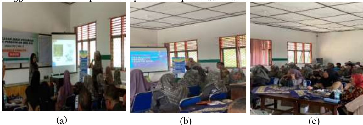
Gambar 1. (a-c). Dokumentasi Kegiatan Pelatihan Penggunaan AR

Tahap berikutnya adalah praktik langsung penggunaan aplikasi AR oleh peserta. Pada tahap ini guru didampingi oleh tim pelaksana kegiatan sehingga peserta dapat mencoba secara langsung penggunaan aplikasi tersebut. Kegiatan praktik ini menjadi bagian penting dalam proses pelatihan karena memberikan pengalaman langsung kepada guru dalam mengoperasikan teknologi AR. Dokumentasi kegiatan praktik penggunaan AR oleh peserta dapat dilihat pada Gambar 1 .