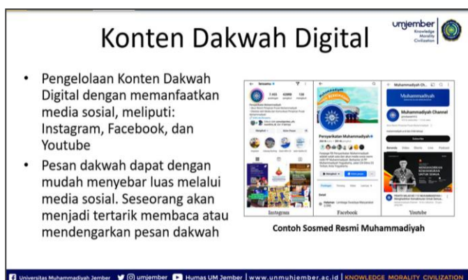
Gambar 5. Pelatihan Pengelolaan Dakwah Digital Secara Daring

Saat sesi penyampaian materi, peserta sangat antusias mengikuti kegiatan. Beberapa peserta menanyakan cara mendesain bahan postingan yang sederhana namun menarik. Pemateri menjelaskan bahwa untuk membuat desain postingan yang sederhana namun menarik, peserta perlu fokus pada tata letak yang rapi, warna yang konsisten, serta penggunaan font yang mudah dibaca, dengan gambar atau ilustrasi berkualitas tinggi dan memastikan informasi utama mudah dipahami. Prinsip-prinsip desain grafis sederhana ini sejalan dengan pedoman visual dakwah digital yang dikemukakan oleh (Fakhruroji, 2019) serta (Ridwan & Ramsiah Tasruddin, 2025), yang menekankan pentingnya kesederhanaan visual, kejelasan pesan, dan konsistensi identitas merek untuk membangun engagement audiens.