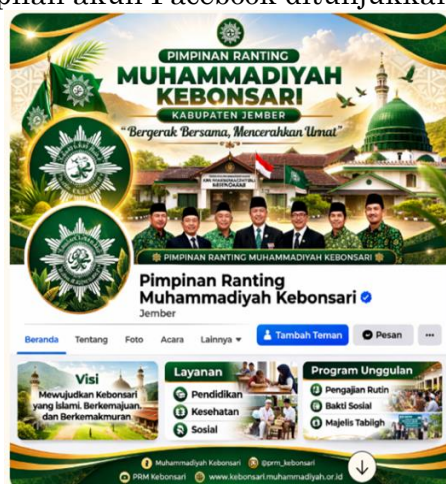
Gambar 3. Akun Facebook PRM Kebonsari

Facebook unggul pada fitur grup komunitas dan jangkauan lintas generasi, terutama kelompok usia 30 tahun ke atas (Rani, 2023; Santika et al., 2025). Akun Facebook PRM Kebonsari difungsikan sebagai forum diskusi keagamaan, penyebaran informasi kegiatan, serta jembatan komunikasi antara pengurus dengan warga ranting dan alumni. Tampilan akun Facebook ditunjukkan pada Gambar 3.