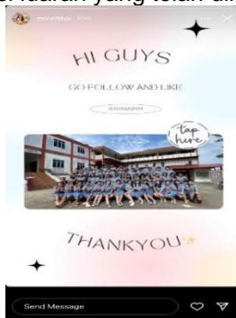
Gambar 5. Posting Foto Siswa Lulusan 2022

Proses implementasi luaran dilakukan dengan memposting foto-foto pada akun media sosial Instagram SMA Kristen Immanuel Batam (Lihat Gambar 5 & Gambar 6). Adapun foto-foto yang dapat diunggah pada akun Instagram mitra meliputi fasilitas-fasilitas sekolah yang terdiri dari lapangan basket, ruang kelas, kegiatan belajar mengajar kelas 12, kegiatan bina rohani di mana sekolah mengadakan lomba yang diikuti semua siswa dari kelas 10 hingga kelas 12. Kegiatan yang diselenggarakan terdiri dari senam dan lomba membuat salib, perayaan hari Paskah dan Kartini yang diselenggarakan secara bersamaan dengan mengadakan perlombaan yang terdiri dari lomba membaca puisi dan lomba menebak gambar. Kemudian foto-foto seleksi OSN (Olimpiade Sains Nasional) yang diikuti murid kelas 10 dan kelas 11, serta foto ujian sekolah 2022 yang diikuti oleh murid kelas 12. Berikut merupakan sampel foto dari implementasi luaran yang telah dilakukan: