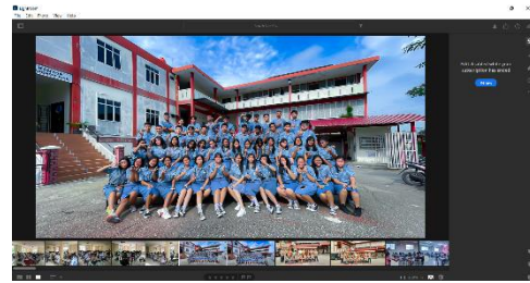
Gambar 1 Tampilan Proses Editing Foto Siswa Lulusan 2022

Berikut adalah sample dari proses editing terhadap foto-foto dari kegiatan yang diperoleh, serta pemberian nama pada setiap foto dan mengkategorikan berdasarkan jenis kegiatan: