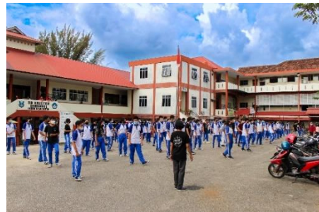
Gambar 2 Kegiatan Bina Rohani, Sumber: Penulis (2022).

Berikut merupakan sampel dari hasil foto yang telah diedit: