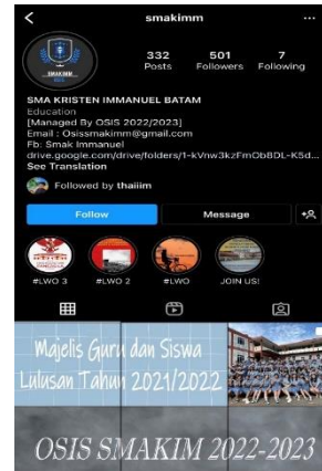
Gambar 6. Postingan Story pada Instagram

Kondisi pada saat setelah melakukan implementasi kegiatan PKM pada SMA Kristen Immanuel Batam adalah sebagai berikut: