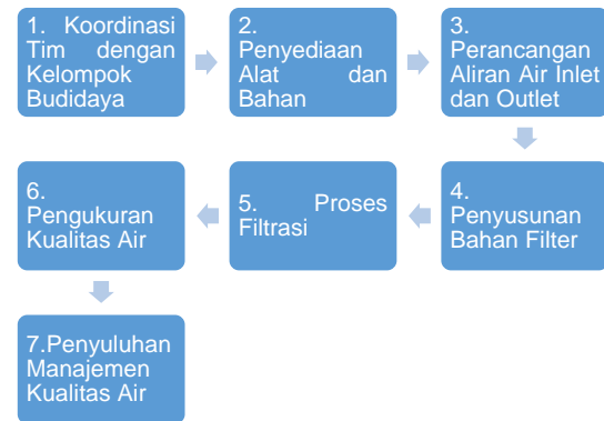
Gambar 1. Tahapan Kegiatan

Kegiatan ini dilaksanakan di Lokasi Wisata Edukasi Perikanan dan Pertanian Desa Tambong, Kecamatan Kabat, Kabupaten Banyuwangi. Sasaran pendampingan ini adalah kelompok budidaya ikan Susukan Lestari dan masyarakat sekitar yang berminat. Pelaksanaan kegiatan ini di uraikan pada Gambar 1.