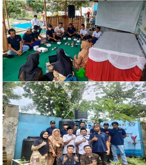
Gambar 5. Kegiatan Penyuluhan

treatment , hal ini perlu diketahui oleh para pembudidaya untuk menjaga bahan filter agar tetap aman bagi ikan dan lingkungan.