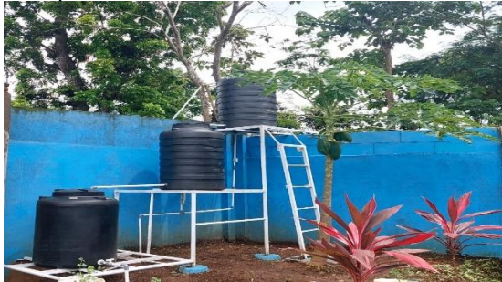
Gambar 2. Desain Pemasangan Wadah Filtrasi

adalah air yang sudah tersaring melalui beberapa media filter yang telah disusun berlapis.