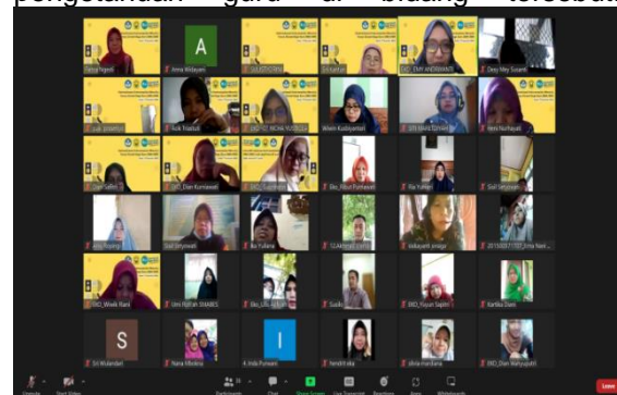
Gambar 3. Potret peserta kegiatan pelatihan

Sesi pemaparan materi diikuti dengan sangat antusias oleh para peserta. Peserta dengan sungguh-sungguh memperhatikan setiap materi yang disampaikan sebagai kompetensi penunjang profesionalitas guru. Pengenalan mengenai tema-tema penulisan karya ilmiah serta sistematika dan prosedur penulisan di jurnal ilmiah juga relevan dengan pengembangan materi dan peningkatan pengetahuan guru di bidang tersebut.