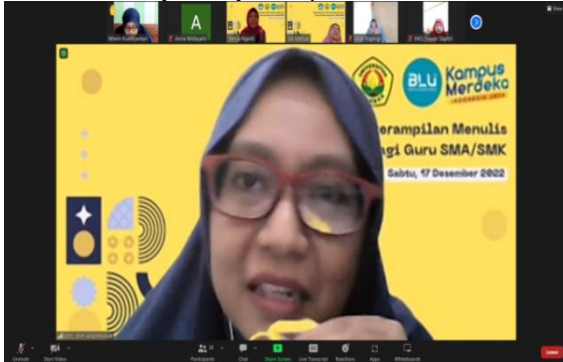
Gambar 4. Peserta pelatihan aktif dalam kegiatan diskusi bersama tim pengabdian

Guru dapat memulai menulis dengan melakukan pengamatan pada kegiatan pembelajaran maupun treatment penyelesaian permasalahan dengan siswa (Maharani and Kartini 2019). Hal ini menjadi langkah awal yang memudahkan guru untuk terbiasa menulis karya ilmiah yang nantinya dapat diterbitkan di jurnal-jurnal pendidikan.