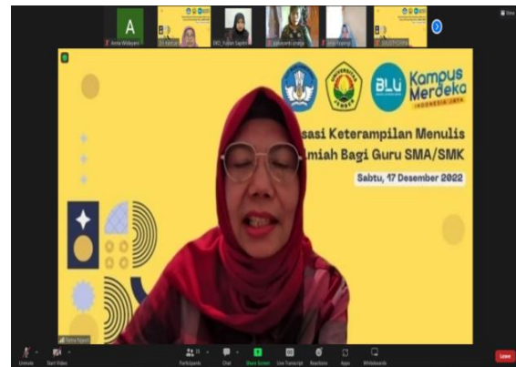
Gambar 2. Pemateri kedua menjelaskan materi

Kedua, kegiatan dilakukan dengan presentasi tentang sistematika penulisan karya ilmiah dan prosedur penulisan di jurnal ilmiah. Setelah menguasai tema yang dapat disusun pada karya ilmiah pendidikan, materi dilanjutkan dengan presentasi tentang sistematika dan prosedur penulisan karya ilmiah pada jurnal ilmiah. Pada materi ini dikupas tuntas pembahasan mengenai bagaimana sistematika serta prosedur diterbitkannya sebuah karya di jurnal ilmiah. Pengetahuan ini sangat penting diberikan kepada guru (Emaliana 2019) agar guru tidak merasa kesulitan untuk mempublikasikan karyanya di jurnal-jurnal ilmiah.