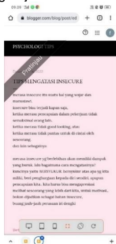
Gambar 9. Luaran Berupa Web Blog Pribadi

Gambar 8 Merupakan sebuah blog hasil karya siswa pada saat pelatihan. Blog yang dibuat bertema tentang pengobatan alternatif dengan judul buah lontar.