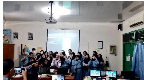
Gambar 7. Siswa Peserta Pelatihan Pembuatan Blog

Gambar 6 memperlihatkan pengabdian memberikan penjelasan ke siswa yang mengalami kesulitan dalam pembuatan blog. Kesulitan yang dihadapi adalah belum bisa melakukan registrasi atau pendaftaran di blogspot.com . setelah di analisis, nama blog yang akan di daftarkan sama atau sudah ada. Kemudian pengabdian memberikan solusi untuk mengubah nama blog yang akan di buat.