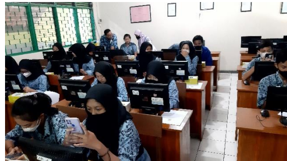
Gambar 6. Penjelasan Pertanyaan Siswa Pembuatan Blog

Seperti gambar 4, gambar 5 menunjukkan pengabdian menjelaskan pentingnya memiliki blog pribadi sebelum pengabdian menjelaskan lebih dalam tentang pembuatan blog.