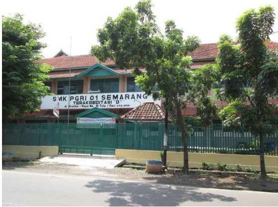
Gambar 1. SMK PGRI 1 Tampak Depan

Untuk mengembangkan minat dan bakat siswa, SMK PGRI 01 Semarang mengadakan berbagai ekstra kurikuler yaitu: Pramuka, English Club, Bola Volley, Paskibra, Tata boga, BTQ, Seni music, Seni tari. Dalam berbagai kompetensi dan perlombaan banyak prestasi yang telah diraih oleh siswa-siswi SMK PGRI 01 Semarang dibidang akademik maupun non akademik.