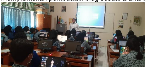
Gambar 5. Penjelasan Pembuatan Blog

Gambar 4 menunjukkan suasana pelatihan pada saat pengabdian menjelaskan materi tentang pembuatan blog. Terlihat siswa konsentrasi dalam mendengarkan dan mempraktekan pembuatan blog sesuai arahan.