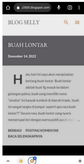
Gambar 8. Luaran Berupa Web Blog Pribadi

Gambar 8 Merupakan sebuah blog hasil karya siswa pada saat pelatihan. Blog yang dibuat bertema tentang pengobatan alternatif dengan judul buah lontar.