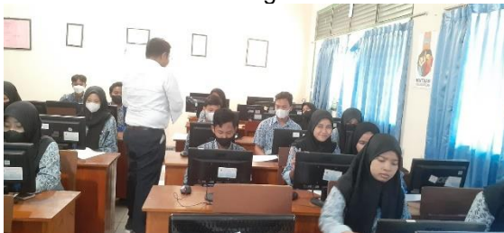
Gambar 4. Siswa Memperhatikan Penjelasan Tentang Fakultas Teknik USM

Gambar 4 menunjukkan suasana pelatihan pada saat pengabdian menjelaskan materi tentang pembuatan blog. Terlihat siswa konsentrasi dalam mendengarkan dan mempraktekan pembuatan blog sesuai arahan.