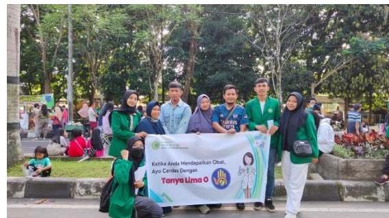
Gambar 4. Kegiatan penyuluhan "Tanya Lima O"

Pada kegiatan ini yang menjadi target sasaran adalah Masyarakat yang sedang mengikuti kegiatan Car Free Day ditaman Udayana Mataram. Metode kegiatan berupa penyuluhan interaktif dengan para masyarakat kemudian diskusi dan tanya jawab. Setelah melaksanakan penyuluhan dilakukan pengisian kuesioner untuk mengukur tingkat pengetahuan masyarakat tentang Tanya Lima O. Kegiatan penyuluhan dapat dilihat pada gambar 1-4. Berdasarkan tes tersebut maka diperoleh hasil nilai pengetahuan dari masyarakat setelah menjawab soal tes yang diberikan. Tingkat pengetahuan dapat dikategorikan menjadi 3 yaitu kategori pengetahuan Baik jika nilainya \geq 76-100 , kategori pengetahuan Cukup jika nilainya 60-75 dan kategori pengetahuan Kurang jika nilainya < 60 .