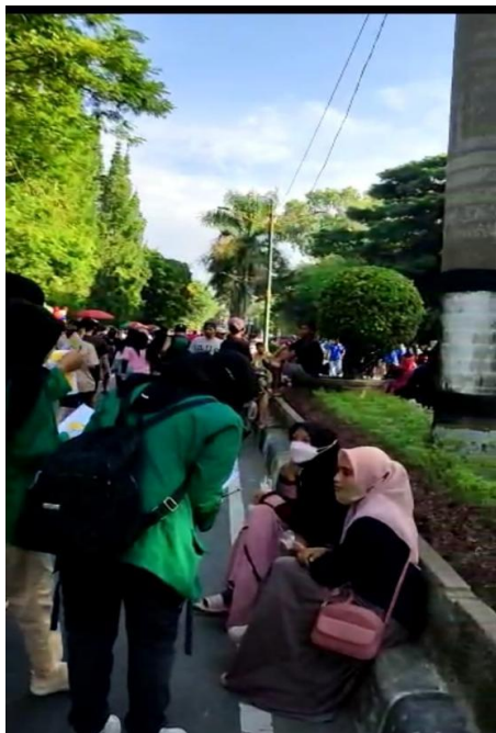
Gambar 2. Penjelasan tentang Tanya Lima O