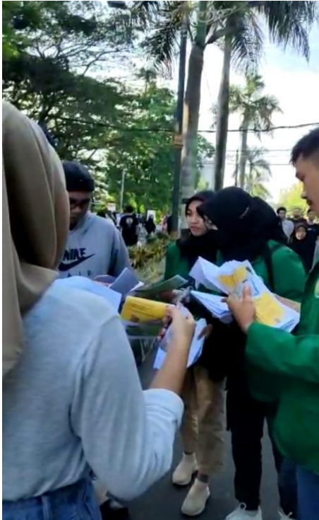
Gambar 1. Pembagian leaflet "Tanya Lima O"