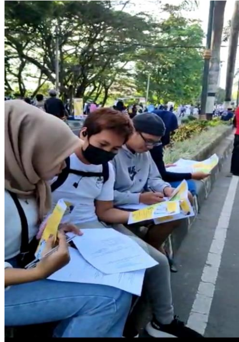
Gambar 3. Pengisian kuesioner pengetahuan Tanya Lima O