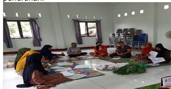
Gambar 3. Kegiatan Post test Penyuluhan Kesehatan

Berdasarkan tabel 1.2 menunjukkan bahwa sebagian besar ibu hamil memiliki pengetahuan yang tinggi yaitu 80%, pengetahuan cukup 12 % dan pengetahuan rendah 8%. terjadi peningkatan pengetahuan ibu hamil tentang kepatuhan dalam mengkonsumsi tablet fe Peningkatan dapat dilihat dari data jumlah ibu hamil yang memiliki pengetahuan tinggi, dari 8% meningkat menjadi 80% setelah mendapatkan pendidikan kesehatan, Sementara itu, jumlah ibu hamil yang memiliki pengetahuan cukup dan kurang mengalami penurunan.