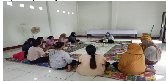
Gambar 2. Kegiatan pemberian Penyuluhan Kesehatan

Tahap kedua merupakan proses pemberian pendidikan kesehatan tentang peningkatan pengetahuan tentang kepatuhan dalam mengkonsumsi tablet fe. Pemberian materi dilaksanakan selama 15 menit dan dilanjutkan dengan tanya jawab selama 10 menit. Para peserta sangat antusias mengikuti kegiatan tersebut, dilihat dari banyaknya peserta yang bertanya dan menjawab ketika diajukan pertanyaan.