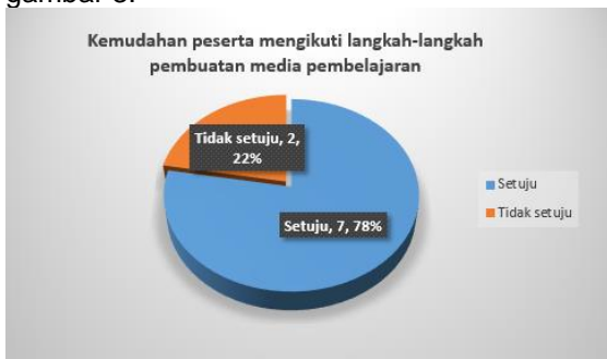
Gambar 3. Kemudahan peserta mengikuti langkah-langkah pembuatan media pembelajaran menggunakan aplikasi canva

Pada akhir kegiatan dilakukan evaluasi dari kegiatan pelatihan yang telah dilakukan, evaluasi ini bertujuan untuk mengetahui sejauh mana peserta dapat menerima dan memahami materi yang telah diberikan. Berdasarkan hasil kuesioner yang diisikan oleh peserta menunjukkan bahwa 78% peserta dapat mengikuti langkah-langkah materi pembuatan media pembelajaran dengan mudah sedangkan 22% peserta merasa mengalami kesulitan dalam mengikuti langkah-langkah yang disampaikan oleh pemateri. Adapun faktor penyebabnya adalah lebih kepada faktor usia peserta dan keterbiasaan peserta untuk menggunakan laptop. Hasil evaluasi terkait dengan kemudahan peserta mengikuti langkah-langkah pembuatan media pembelajaran menggunakan aplikasi canva ditunjukkan pada gambar 3.