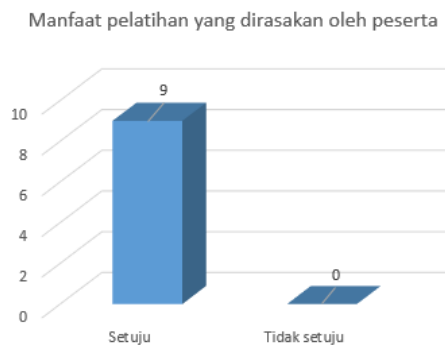
Gambar 5. Manfaat yang dirasakan peserta setelah mengikuti pelatihan

Dan pada hasil yang lain diketahui bahwa seluruh peserta menyebutkan bahwa aplikasi canva mudah digunakan sebagai alat bantu pembuatan media pembelajaran baik dalam bentuk presentasi atau dalam bentuk video pembelajaran. Atau dengan kata lain bahwa 100% peserta merasa bahwa aplikasi canva telah membantu mereka mempermudah dalam membuat media pembelajaran yang interaktif dan menarik. Gambar 6 menunjukkan hasil jawaban peserta terkait dengan kemudahan menggunakan aplikasi canva.