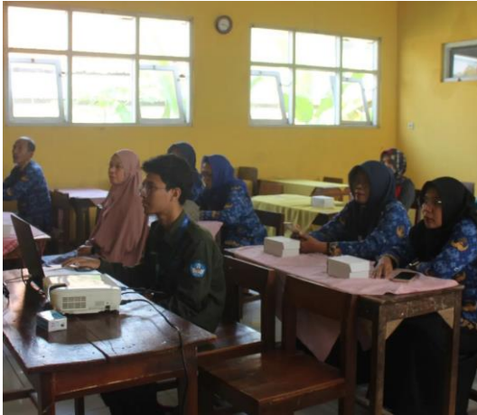
Gambar 2. Peserta memperhatikan pada saat penyampaian materi

Pada akhir kegiatan dilakukan evaluasi dari kegiatan pelatihan yang telah dilakukan, evaluasi ini bertujuan untuk mengetahui sejauh mana peserta dapat menerima dan memahami materi yang telah diberikan. Berdasarkan hasil kuesioner yang diisikan oleh peserta menunjukkan bahwa 78% peserta dapat mengikuti langkah-langkah materi pembuatan media pembelajaran dengan mudah sedangkan 22% peserta merasa mengalami kesulitan dalam mengikuti langkah-langkah yang disampaikan oleh pemateri. Adapun faktor penyebabnya adalah lebih kepada faktor usia peserta dan keterbiasaan peserta untuk menggunakan laptop. Hasil evaluasi terkait dengan kemudahan peserta mengikuti langkah-langkah pembuatan media pembelajaran menggunakan aplikasi canva ditunjukkan pada gambar 3.