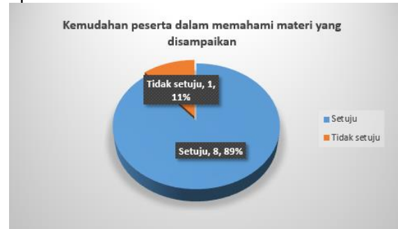
Gambar 4. Kemudahan peserta dalam memahami materi yang disampaikan

pembelajaran, bahwa seluruh peserta atau 100% menjawab kegiatan pelatihan telah memberikan manfaat bagi peserta khususnya meningkatkan kemampuan mereka dalam menggunakan aplikasi canva sebagai alat bantu membuat media pembelajaran yang interaktif dan menarik. Pada gambar 4 dan 5 menunjukkan hasil evaluasi terkait dengan kemudahan peserta memahami materi pelatihan dan manfaat yang dirasakan oleh peserta setelah mengikuti kegiatan pelatihan pembuatan media pembelajaran menggunakan aplikasi canva.