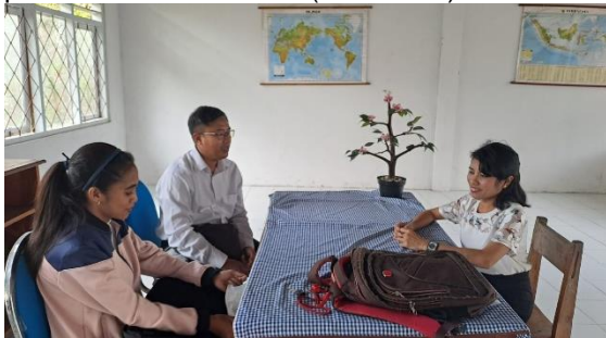
Gambar 2. Observasi di SMA Dharma Ayu

Tahap persiapan merupakan tahap analisis permasalahan yang ada di sekolah serta dibutuhkan solusi permasalahan atas permasalahan tersebut (Gambar 2).