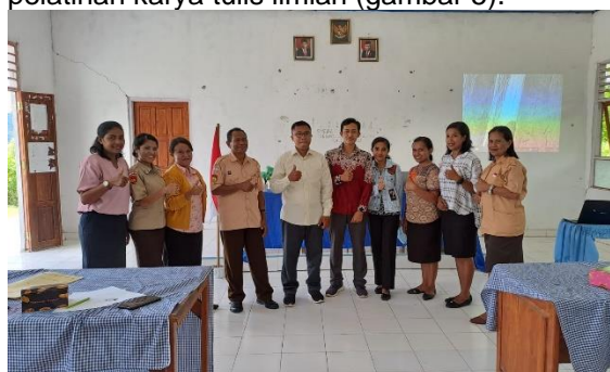
Gambar 5. Foto bersama peserta pelatihan karya tulis ilmiah di SMA Dharma Ayu

Berdasarkan tabel 2. hasil evaluasi pelatihan menunjukkan aspek materi mendapatkan respon positif dengan rata-rata 83% sangat baik, 15% baik, dan 2% cukup, sedangkan aspek pelayanan juga mendapatkan respon positif dengan rata-rata 85% sangat baik, 14% baik, dan 1% cukup, Hasil diatas menunjukkan kepuasan peserta terhadap pelatihan kepenulisan karya ilmiah di SMA Dharma Ayu tergolong sangat baik, meskipun tetap ada beberapa kekurangan yang dapat dijadikan pelajaran untuk pelatihan berikutnya. Proses pelatihan kepenulisan karya ilmiah ditutup dengan foto bersama peserta pelatihan karya tulis ilmiah (gambar 5).