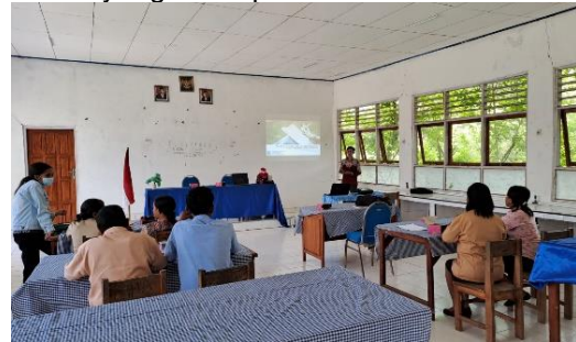
Gambar 3. Pemberian materi kepenulisan karya tulis ilmiah di SMA Dharma Ayu

Metode ceramah merupakan metode narasumber memberikan penjelasan materi secara langsung kepada pendengar. Gambar 3 menunjukkan proses pelatihan berlangsung dimana narasumber memberikan penjelasan terkait dengan karya tulis ilmiah yang berisi beberapa poin penting seperti cara menentukan ide judul penelitian, menyusun judul penelitian agar menarik, menyusun latar belakang, menentukan metode penelitian, menulis pembahasan, membuat kesimpulan, referensi, cara mengidentifikasi jurnal, melihat deadline publikasi, biaya publikasi, arsip jurnal, dan cara melakukan submit artikel. Materi-materi tersebut disajikan secara menarik dengan menggunakan power point. Selama narasumber memberikan penjelasan, peserta antusias dalam mendengarkan penjelasan narasumber. Beberapa guru mengajukan pertanyaan terkait dengan penjelasan materi yang disampaikan oleh narasumber.