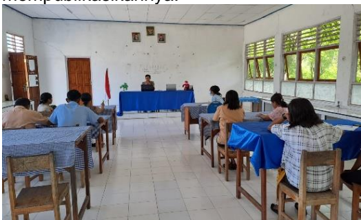
Gambar 4. Proses praktik pembuatan karya tulis ilmiah di SMA Dharma Ayu

publikasi, biaya publikasi, download template artikel, dan cara publikasi artikel. Dari 11 peserta, 7 peserta sangat antusias untuk belajar membuat proposal penelitian, menulis naskah artikel, dan mempublikasikannya.