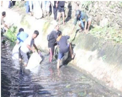
Gambar 1. Kondisi sungai

Kesadaran masyarakat terhadap lingkungan sangatlah minim, berdasarkan hal tersebut dapat diprediksi bahwa masyarakat masih belum peduli terhadap kebersihan lingkungan sekitarnya. Kebanyakan dari masyarakat berfikir secara parsial dan hanya ingin menguntungkan diri sendiri, seperti masalah pembuangan sampah yang tidak pada tempatnya, pembuangan limbah rumah tangga dan banyaknya sampah yang menumpuk di saluran air sungai yang bisa menyebabkan banjir karena meluapnya air sungai yang tidak tertampung.