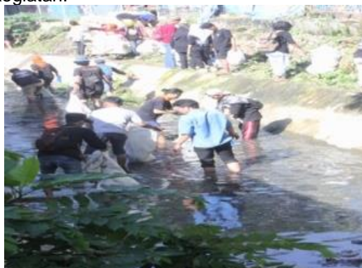
Gambai 2. Kegiatan pembersihan sampah di sungai

Kegiatan ini diawali dengan Sosialisasi dan survei lokasi sungai yang akan dibersihkan. Di lanjut dengan mendiskusikan jadwal pelaksanaan guna melakukan koordinasi terhadap pemerintah setempat. Setelah waktu di sepakati lalu menyiapkan dan mengantar surat izin pelaksanaan PKM ke Lurah. selanjutnya kegiatan inti yaitu pembersihan lokasi PKM dengan persiapan alat yang akan di gunakan dalam proses kegiatan.