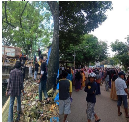
Gambai 3. Kegiatan bersih bersih di sepanjang jalan

akan pentingnya menjaga kebersihan guna melestarikan lingkungan dan meningkatkan kualitas kesehatan. Namun dalam pelaksanaan meningkatkan pemahaman tersebut dibutuhkan motivasi lebih lanjut baik dari civitas akademik, pemerintah maupun dari organisasi pecinta lingkungan.