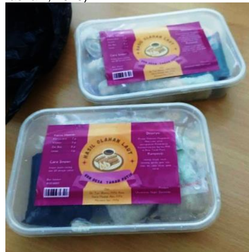
Gambar 5. Produk Hasil Pelatihan yang Dijadikan Produk Olahan

Pengolahan hasil laut dapat menumbuhkan kemandirian entrepreneurship karena hasil-hasil olahan laut tersebut dapat dipromosikan sebagai produk makanan ringan ataupun frozenfood yang memiliki nilai tambah dan cita rasa yang lezat. Hasil laut jika diolah menjadi makanan akan menambah nilai jualnya juga. Ketika Ibu-ibu PKK memiliki kreatifitas dalam menghasilkan olahan laut yang memiliki nilai jual maka dapat menjadi peluang usaha bagi mereka untuk mendapatkan penghasilan lebih (Maryati & Masriani, 2019).