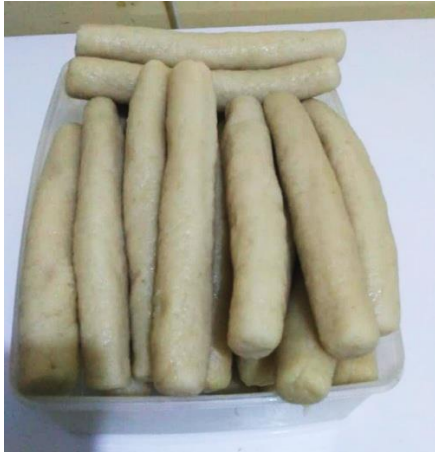
Gambar 4. Contoh Hasil Pelatihan yang dihasilkan oleh Ibu-ibu PKK

Hal ini juga ditunjukkan melalui tiga proses yaitu pada proses awal diperlukan persiapan atau perencanaan sebelum ke lokasi yaitu instruktur dan ibu-ibu PKK bekerjasama mengadakan alat dan bahan sesuai dengan komposisi dan alatnya berupa kompor, baskom, panci atau wajan dan kebutuhan lainnya. Proses persiapan ini dilakukan untuk memenuhi kelancaran proses pelatihan nantinya termasuk kemasan dan logo packaging sebagai pelengkap produk siap jual dan konsumsi.