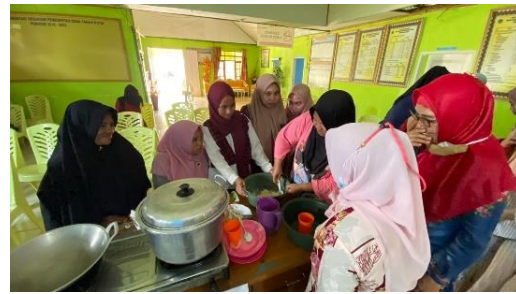
Gambar 2. Pembuatan empek-empek

Perubahan pengetahuan Ibu-ibu tentang pengolahan hasil laut juga bertambah dari yang awalnya hanya menggunakan ikan untuk lauk makanan dan hanya disimpan di freezer, kini mereka memahami bahwa ikan dapat dijadikan makanan ringan yang enak dan memiliki daya saing seperti otak-otak dan empek-empek.