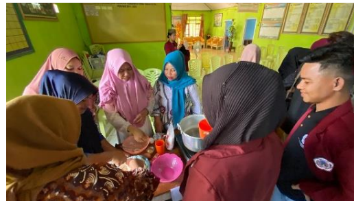
Gambar 3. Pendampingan Mahasiswa dalam pembuatan empek-empek

Pada proses pelatihan Ibu-ibu PKK menanyakan hal-hal mengenai opsi lain dari bahan-bahan yang digunakan. Selain menggunakan ikan laut, empek-empek juga dapat diolah menggunakan udang kering dan air tawar seperti ikan gabus. Ibu-ibu PKK sangat sangat antusias dalam proses pelatihan. Mereka berkreasi sesuai dengan ide mereka.