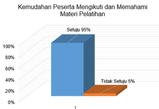
Gambar 3. Kemudahan Peserta Mengikuti dan Memahami Materi

Selanjutnya berkaitan dengan hasil evaluasi penyelesaian peserta dalam pengisian BKD menunjukkan hasil bahwa 80% peserta telah menyelesaikan pengisian BKD dan mengirimkan LBKD kepada Asesor dan 20% peserta masih belum menyelesaikan dikarenakan masih melengkapi bukti-bukti pendukung kinerja. Gambar 4 menampilkan grafik hasil dari penyelesaian peserta mengisi BKD.