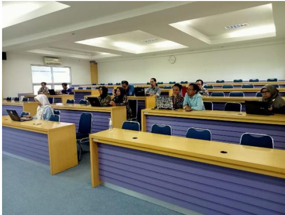
Gambar 2. Peserta Kegiatan Pelatihan.