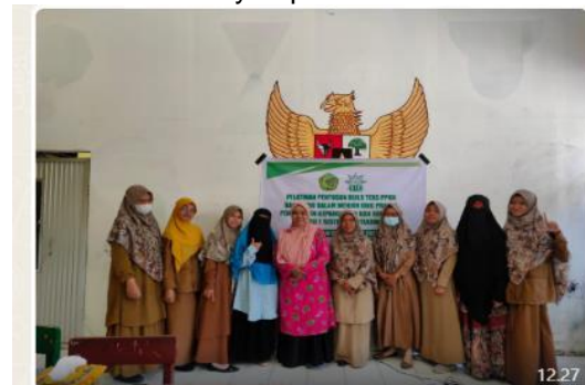
Gambar 2. Peserta Pelatihan Buku ajar Buku Teks PPKn.