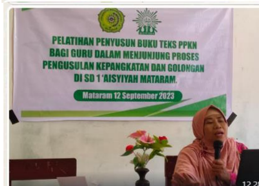
Gambar 1. Penyampaian Materi Pelatihan