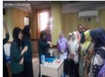
Gambar 3. Demonstrasi Pembuatan Yoghurt oleh Tim Mahasiswa

Demonstrasi pembuatan yoghurt oleh tim mahasiswa Prodi Kimia (sebanyak lima orang) berlangsung di SMAN 81 Jakarta pada hari Kamis 3 Agustus 2023 yang terlihat pada gambar 2.. Para peserta terlihat semangat dan antusias. Starter yang digunakan adalah yoghurt bermerek Biokul dan Yakult. Beberapa tips penting diberikan kepada peserta agar keberhasilan proses pembuatan yoghurt maksimal, antara lain sterilisasi alat menggunakan sabun dan perendaman alat dalam air panas mendidih untuk mencegah kontaminasi susu oleh jamur atau bakteri; pemanasan susu dengan api kecil dan jangan sampai mendidih karena akan merusak protein susu; dipastikan susu dalam keadaan hangat, tidak panas dan tidak dingin saat diberikan starter; penggunaan wadah kedap udara, tertutup rapat dan dalam ruang gelap; penyimpanan yoghurt di kulkas jangan di freezer karena akan mengubah tekstur dan merusak kualitas yoghurt; memperhatikan waktu kadaluarsa dari starter Biokul; kegagalan selama pembuatan yang sering terjadi umumnya karena kontaminasi mikroorganisme, khususnya kapang dan khamir yang relatif tahan terhadap asam.