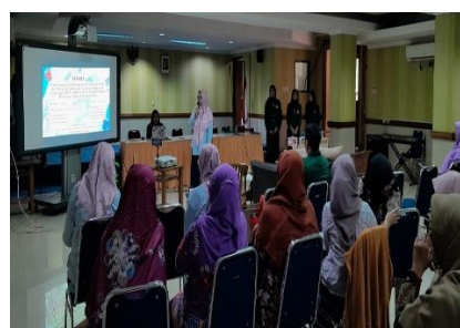
Gambar 1. Pemaparan Materi oleh Tim Dosen dan Tim Mahasiswa

Selanjutnya, tim dosen UNJ memberikan paparan kepada para peserta tentang beberapa alasan susu tidak disukai oleh masyarakat karena menyebabkan perut kembung, diare, dan sering buang angin setelah dikonsumsi seperti yang digambarkan dalam gambar 1. Penderita intoleransi laktosa mengalami gejala gangguan pencernaan diatas karena tidak diproduksinya enzim alami (yaitu