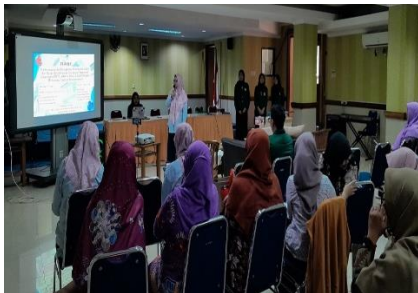
Gambar 2. Pemaparan Materi oleh Tim Dosen dan Tim Mahasiswa

laktase) dalam usus halus atau produksi laktase yang rendah (Rings et al., 1994). Laktase berfungsi menghidrolisis laktosa menjadi galaktosa dan glukosa lalu keduanya diserap dan digunakan sebagai sumber energi (Sfakianakis & Tzia, 2014). Walaupun tidak berbahaya, namun gejala intoleransi laktosa dapat menimbulkan ketidaknyamanan. Oleh karena itu susu diolah melalui proses fermentasi memakai gabungan dua bakteri asam laktat yaitu bakteri Lactobacillus bulgaricus dan Streptococcus thermophilus sehingga diperoleh yoghurt dan penderita intoleransi laktosa dapat mengkonsumsi yoghurt tersebut (Liu et al., 2016).