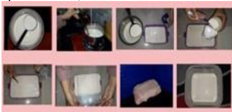
Gambar 4. Tahapan Pembuatan Yoghurt

pengaruh penggunaan starter yang berasa atau susu berbagai rasa; apakah bisa menggunakan starter yoghurt selain Biokul dan Yakult; setelah yoghurt hasil fermentasi terbentuk, apakah bisa langsung dikonsumsi; jika yoghurt yang dihasilkan semakin asam bagaimana pengaruhnya bagi tubuh kita; apakah bisa ditambahkan perisa esensial/ artificial ke dalam yoghurt; apakah masa inkubasi dapat kurang dari 18 jam; apa yang terjadi ketika masa inkubasi lebih dari 24 jam; setelah masa inkubasi 24 jam apakah yoghurt langsung dimasukkan ke dalam kulkas dengan wadah yang sama atau harus dipindahkan ke dalam wadah lainnya yang sudah steril; jika ditambahkan tambahan bahan lain seperti selai atau perisa buah, dilakukan setelah inkubasi.