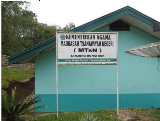
Gambar 1. MTsN 6 Sijunjung

aplikasi dalam kehidupan sehari-hari dan karir di masa depan.