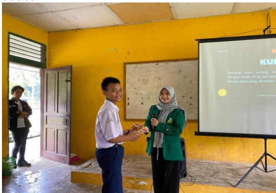
Gambar 5. Pemberian reward kepada salah satu siswa yang mampu menjawab dengan benar.

Jangkauan ketinggian dari roket air yang diluncurkan mencapai 35 kaki atau mencapai 10 meter. Hal ini bergantung pada factor berupa tekanan udara dalam botol, berat total dari roket, sudut peluncuran, dan kondisi cuaca.