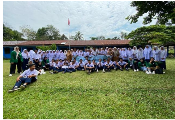
Gambar 6. Dokumentasi Bersama seluruh siswa-siswi MTsN 6 Sijunjung

Dalam sesi akhir dilakukan evaluasi. Evaluasi ini bertujuan untuk mengetahui dan mengukur kepehaman siswa mengenai materi maupun prinsip kerja roket air. Dari pertanyaan yang diberikan, 85 % Siswa-siswi yang mengikuti kegiatan ini sudah memahami teori dasar Hukum Newton 1, 2, dan 3 dan aplikasinya.