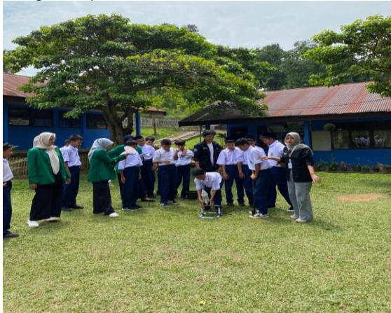
Gambar 4: Praktik Fisika mengenai Roket Air

sehingga menghasilkan gaya dorong yang mendorong roket ke atas. Roket akan meluncur dengan cepat ke udara.