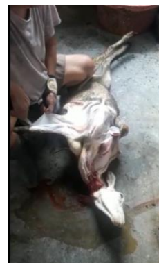
Gambar 2. Proses pengambilan kulit kambing dilakukan secara manual

Pekerjaan pengambilan daging kambing kelihatannya sederhana, namun memerlukan tahapan yang memerlukan keahlian khusus. Menurut penuturan Pak Jahir, sate kambing nanti lunak atau tidak lunak, bau prengus atau tidak kuncinya pada proses penyembelihan dan cara pengambilan daging.