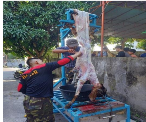
Gambar 5. Ujicoba penarikan kulit kambing menggunakan alat penyembelih dan penarik kulit kambing terpadu