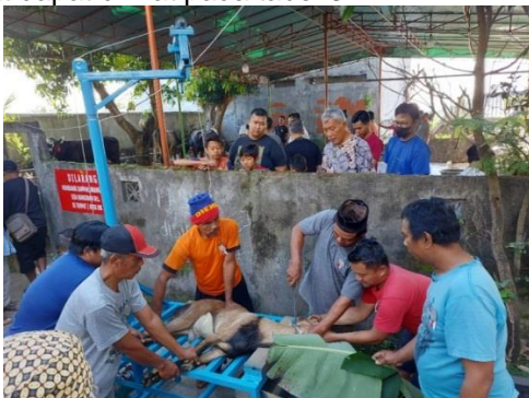
Gambar 4. Ujicoba penyembelihan kambing menggunakan alat penyembelih dan penarik kulit kambing terpadu

Namun demikian alat ini masih perlu disempurnakan agar hasilnya lebih maksimal. Beberapa masukan dari penjagal dan petugas penyembelih antara lain adalah: 1) Tinggi meja supaya diperpendek sedikit sekitar 10 cm; 2) Perlu adanya poros roll yang lebih lebar untuk menggantikan katrol supaya kulit kambing tidak terjepit di katrol, sedangkan spesifikasi alat dapat dilihat pada tabel 3.