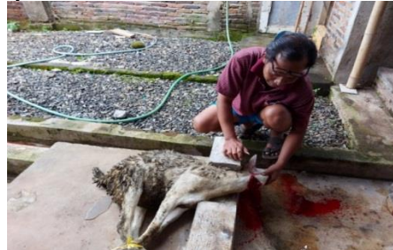
Gambar 1. Proses penyembelihan kambing tanpa meja khusus

dan Gambar 2, dibutuhkan waktu sekitar 1 jam untuk memotong hingga pengambilan kulit dan daging kambing. Jika jumlah kambing yang dipotong banyak, tentu saja cukup membutuhkan waktu lama dan memberatkan pekerja.