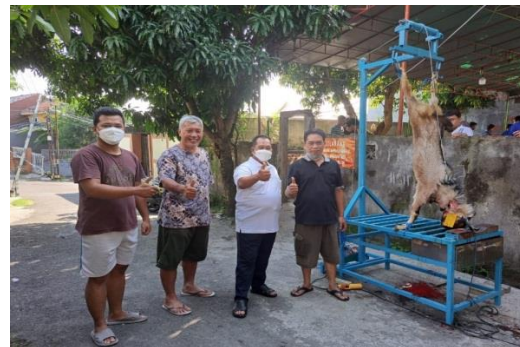
Gambar 6. Foto bersama tim pelaksana dan Bapak Rektor Unnes selaku warga perumahan.

Untuk mengetahui kelayakan desain alat, tim pelaksana membuat angket yang diberikan kepada warga yang melihat dan terlibat langsung dalam proses penyembelihan dan pengulitan kulit kambing. Angket diberikan kepada 25 responden. Berdasarkan perhitungan diperoleh persentase skor 83,1% yang dapat diartikan bahwa desain alat bantu penyembelihan dan pengulitan kambing sangat layak untuk digunakan.