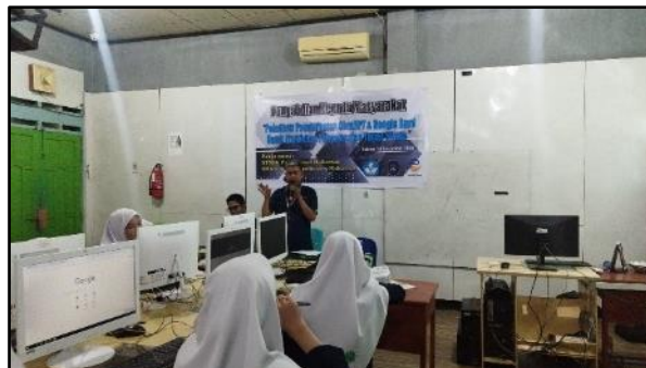
Gambar 3. Presentasi Materi oleh Dosen

Dalam kegiatan pelatihan tersebut, 2 (dua) orang dosen bertindak sebagai pemateri yang secara bergantian menjelaskan materi dengan metode ceramah, dan 2 orang pendamping yang terdiri dari 1 orang dosen dan 1 orang mahasiswa yang membantu siswa/i jika mendapatkan kesulitan dalam mengikuti pelatihan khususnya pada sesi praktikum. Seperti terlihat pada Gambar 3, seorang dosen memaparkan materi.