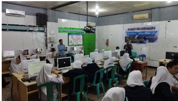
Gambar 4. Siswa/i SMK Muhammadiyah 3 Makassar Sedang Melaksanakan Praktikum

Dari gambar 4 terlihat bahwa siswa/i sangat antusias melakukan praktikum, mereka sangat merespon positif terhadap kegiatan pelatihan ini, terlihat dari keseriusan mereka dalam memperhatikan penjelasan materi praktikum dari dosen pematari.