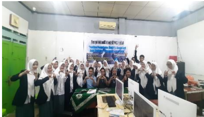
Gambar 6. Foto Bersama Tim PkM dan Siswa/i SMK Muhammadiyah 3 Makassar