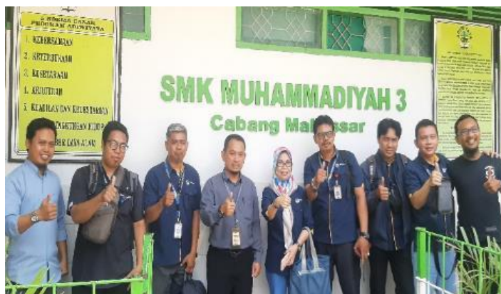
Gambar 7. Foto Bersama Tim PkM dan Bapak Kepala Sekolah SMK Muhammadiyah 3 Makassar