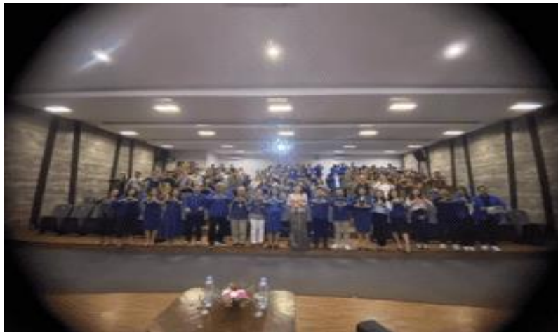
Gambar 3: Peserta Pelatihan SAK Entitas Privat

pemangku kepentingan untuk mendukung pengelolaan bisnis yang efektif dan pembuatan keputusan yang tepat.