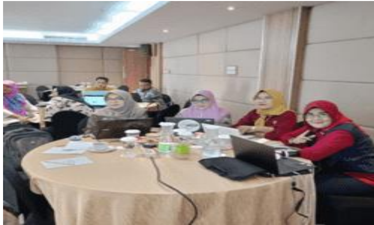
Gambar 1 : Nara Sumber Pelatihan SAK Entitas Privat

Selanjutnya mengevaluasi Kinerja Grup Usaha bagi perusahaan yang memiliki entitas anak atau terkait, konsolidasi laporan keuangan memungkinkan evaluasi kinerja keseluruhan grup usaha daripada hanya melihat kinerja individual dari setiap entitas. Ini membantu manajemen dalam mengelola dan mengoptimalkan sumber daya secara efektif di seluruh organisasi (Berliana et al., 2022). Pemenuhan Persyaratan Hukum dan Regulasi sebagian besar yurisdiksi memerlukan entitas bisnis untuk menyusun laporan keuangan konsolidasi sesuai dengan persyaratan hukum dan regulasi yang berlaku. Dengan menyusun laporan konsolidasi, perusahaan memenuhi kewajiban peraturan tersebut.