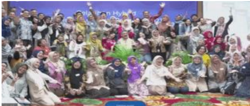
Gambar 4: Peserta Pelatihan SAK Entitas Privat

Dengan mengikuti langkah-langkah ini, organisasi dapat memastikan bahwa pelatihan yang diselenggarakan memberikan manfaat maksimal bagi peserta dan memberikan kontribusi positif terhadap pencapaian tujuan organisasi.