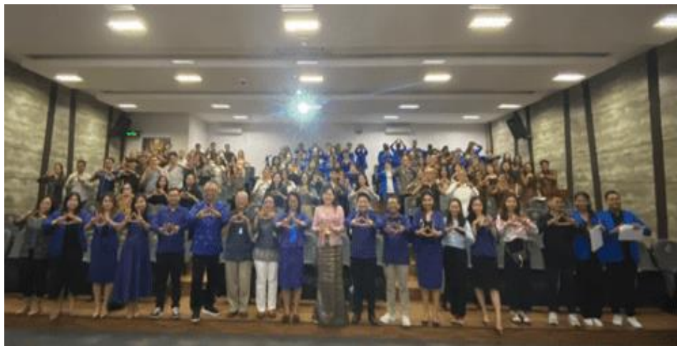
Gambar 2: Peserta Pelatihan SAK Entitas Privat

Selanjutnya mengevaluasi Kinerja Grup Usaha bagi perusahaan yang memiliki entitas anak atau terkait, konsolidasi laporan keuangan memungkinkan evaluasi kinerja keseluruhan grup usaha daripada hanya melihat kinerja individual dari setiap entitas. Ini membantu manajemen dalam mengelola dan mengoptimalkan sumber daya secara efektif di seluruh organisasi (Berliana et al., 2022). Pemenuhan Persyaratan Hukum dan Regulasi sebagian besar yurisdiksi memerlukan entitas bisnis untuk menyusun laporan keuangan konsolidasi sesuai dengan persyaratan hukum dan regulasi yang berlaku. Dengan menyusun laporan konsolidasi, perusahaan memenuhi kewajiban peraturan tersebut.