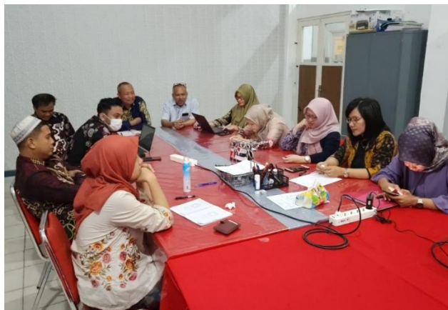
Gambar 1. Suasana diskusi tentang kendala yang dihadapi guru saat menulis publikasi

Pada tahap persiapan, tim pengabdian masyarakat bertemu dan berdiskusi dengan Kepala Sekolah, Wakil Kepala Sekolah Bidang Kurikulum dan para guru SMK Telkom Banjarbaru di Banjarbaru Kalimantan Selatan. Pertemuan dilaksanakan di ruang rapat SMK Telkom Banjarbaru (Gambar 1). Diskusi dengan guru untuk memperoleh informasi tentang kesulitan dan kendala yang dihadapi. Pada kegiatan ini ada beberapa kendala yang dihadapi oleh guru SMK Telkom Banjarbaru dalam publikasi. Kendala-kendala tersebut antara lain a) belum banyak yang mengetahui fokus dan scope jurnal dan informasi penting tentang jurnal b) belum mengenal template dan indeksasi c) belum mengetahui cara menulis artikel secara baik d) belum mengetahui cara menelusur dan submit jurnal. Berdasarkan kendala tersebut, kemudian dibuat materi-materi yang dapat memberikan solusi.