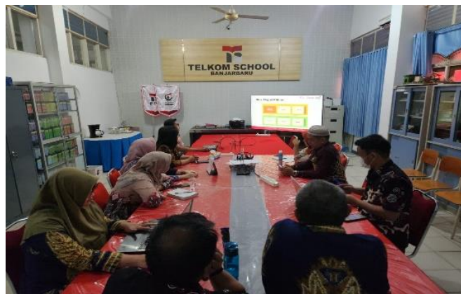
Gambar 3. Suasana pelatihan menulis artikel untuk publikasi

Setelah memahami alamat jurnal dan template, pada hari ke dua peserta diberikan pelatihan penulisan artikel ilmiah (Gambar 3.).