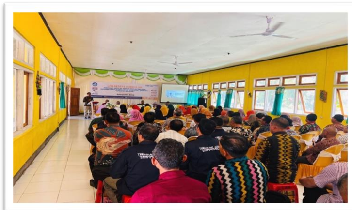
Gambar 8. Kegiatan Penyajian Loka Kombel

Penyajian loka kombel berupa penyuguhan produk aktivitas sekolah penggerak yang dilaksanakan selama sekolah tersebut mengikuti program tersebut. Ragam penyajian produk aktivitas sekolah penggerak dilakukan secara terpusat di SMAN 1 Madapangga. Kegiatan ini bertujuan untuk menyajikan hasil pelaksanaan kombel di sekolah masing-masing. Kemudian, setiap sekolah melakukan sesi berbagi dengan dengan sekolah lain untuk memperkaya bentuk pelaksanaan kombel yang adaptif, inovatif, dan kreatif. Pelaksanaan penyajian loka dapat disimak pada gambar 7.