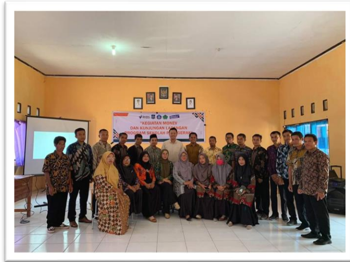
Gambar 7. Kegiatan Kunjungan Lapangan SMAN 2 Sanggar

berbagi aspirasi antarkombel sekolah. Aktivitas pra kombel dilakukan melalui kegiatan kunjungan lapangan ke sekolah, seperti pada gambar 6.