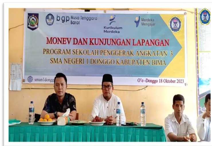
Gambar 5. Kegiatan Kunjungan Lapangan SMAN 1 Donggo

Kegiatan loka kumpul SMAN 1 Donggo dimulai dari tugas dan pokok setiap unsur dalam komite pembelajaran. Beberapa unsur meliputi peran a) pengawas: mengadakan pertemuan evaluasi dan penyusunan rencana pembangunan komunitas belajar. b) Kepala Sekolah, membuat kebijakan sekolah yang mendukung pembangunan komunitas belajar dan mengalokasikan sumber daya yang diperlukan. c) Guru, menyelenggarakan sesi pembelajaran kolaboratif dan berbagi praktik terbaik. d) Seluruh Anggota komunitas, mengadakan acara pembukaan komunitas belajar dan pameran hasil-hasil pembelajaran. Target yang dicapai yakni dapat meningkatkan partisipasi aktif setiap elemen dalam komite pembelajaran. Indikator kegiatan kumpul ditandai dengan meningkatnya kehadiran dan keterlibatan guru dalam berbagai kegiatan kumpul sekolah, peningkatan penerapan praktik baik pembelajaran inovatif dalam pemenuhan hasil belajar siswa, peningkatan evaluasi belajar siswa, dan peningkatan partisipasi – antusiasme guru dan siswa dalam kumpul sekolah. Pihak yang terlibat dalam kegiatan kumpul yakni seluruh pihak dalam komite pembelajaran sekolah. Strategi pelaksanaan kumpul sekolah dilakukan dengan cara mengidentifikasi hambatan dan kebutuhan guru, memberikan dukungan dan bimbingan yang dibutuhkan, serta mengukur kemajuan melalui survei kepuasan kumpul sekolah. Aktivitas pra kumpul dilakukan melalui kegiatan kunjungan lapangan ke sekolah, seperti pada gambar 5 di bawah ini.