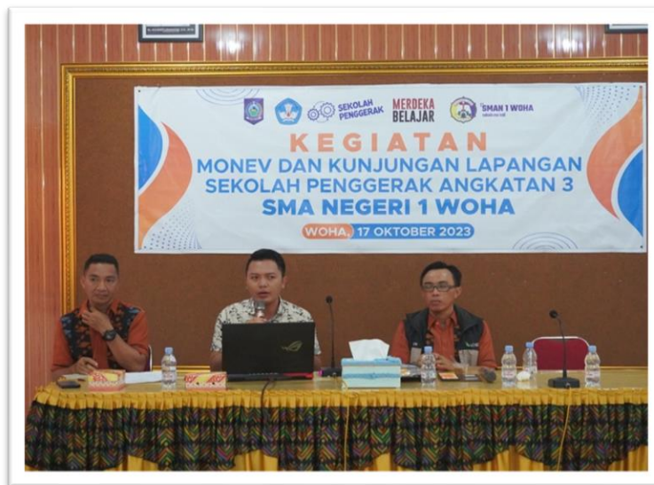
Gambar 4. Kegiatan Kunjungan Lapangan SMAN 1 Woha

Kegiatan loka kombel SMAN 1 Woha dimulai dari membentuk kelompok diskusi terstruktur untuk guru dan siswa, antarguru dalam MGMP, serta guru dengan penggerak Kombel. Target kegiatan yakni Mendorong kolaborasi antara warga sekolah baik guru dan siswa, antarguru, maupun guru dengan pimpinan di sekolah. Indikator keberhasilan kegiatan berupa terbentuknya jaringan kerja sama antar warga sekolah. Pihak yang dilibatkan dalam kombel yakni: a) guru-guru dari berbagai mata pelajaran, b) siswa dari berbagai tingkatan kelas, c) tim penggerak Kombel, dan d) Kepala sekolah dan staf sekolah pendukung. Strategi pelaksanaan kegiatan kombel melalui kegiatan pertemuan awal untuk memperkenalkan konsep dan manfaat komunitas belajar secara berjenjang dimulai dari kelas antara guru dengan siswa, kemudian hasilnya disampaikan dalam pertemuan MGMP, yang kemudian dibahas oleh tim penggerak Kombel dengan Kepala Sekolah dan staf sekolah pendukung. Aktivitas pra kombel dilakukan melalui kegiatan kunjungan lapangan ke sekolah, seperti pada gambar 4 di bawah ini.