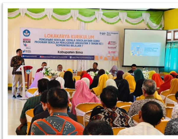
Gambar 2. Pembukaan Loka Kombel

Berdasarkan kegiatan pendampingan yang telah dilakukan oleh FSP terhadap keempat sekolah (SMAN 1 Woha, SMAN 1 Madapangga, SMAN 1 Donggo, dan SMAN 2 Sanggar) diperoleh beberapa hasil dampingan. Keempat hasil Loka Kombel ini merujuk pada metode dan strategi pendampingan yang meliputi a) perencanaan, pendampingan, dan c) refleksi loka kombel. Kemudian, berdasarkan ketiga alur tersebut diformasikan ke dalam beberapa aktivitas pendampingan terpusat, yakni kegiatan dampingan, target, indikator keberhasilan, pihak yang dilibatkan, dan strategi pelaksanaan kegiatan kombel. Berikut dokumentasi kegiatan pendampingan kombel sekolah sebagai berikut: