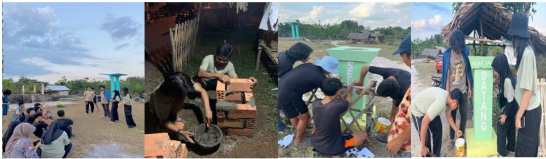
Gambar 2. Sosialisasi Pembuatan Tugu Wisata

Berikut adalah beberapa hasil yang mungkin dicapai: