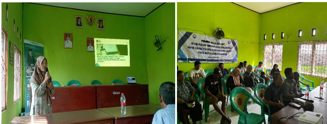
Gambar 2. Pelatihan ini mencakup cara membuat tautan yang dapat dibagikan menggunakan layanan seperti bit.ly atau dalam bentuk kode barcode .

Tim Pengabdian kepada Masyarakat (PkM) dari Universitas Singaperbangsa Karawang menggelar pelatihan bagi staf kantor desa mengenai penggunaan Google Form dan Google Drive pada Jumat, 19 Juli 2024. Pelatihan ini mencakup pengenalan produk Google yang bermanfaat untuk kebutuhan administrasi. Peserta pelatihan, yaitu staff kantor desa, diajak untuk praktik langsung dalam membuat formulir menggunakan Google Form, sesuai dengan posisi dan tugas mereka. Setelah berhasil membuat formulir, peserta pelatihan dibimbing untuk membuat link yang dapat dibagikan dengan menggunakan layanan seperti link bit.ly atau dalam bentuk barcode terlihat pada Gambar 2.