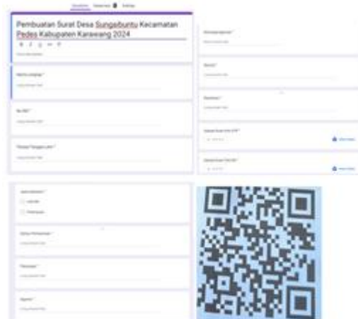
Gambar 5. Google Form sudah siap digunakan untuk memberikan layanan kepada Masyarakat

Berikut adalah Google Form dan Google Drive yang telah berhasil dibuat dan siap digunakan untuk memberikan layanan kepada masyarakat selama 1 x 24 jam pada hari kerja, sebagaimana ditunjukkan pada Gambar 5 dan Gambar 6.