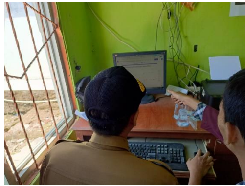
Gambar 3. Pelatihan Pemanfaatan Google Form dan Google Drive untuk Staf Kantor Desa

Peserta menunjukkan antusiasme yang tinggi selama pelatihan penggunaan Google Form dan Google Drive. Mereka berharap pelatihan serupa dapat diadakan secara rutin di desa, sehingga staf kantor desa dapat terus meningkatkan pengetahuan dan keterampilan mereka. Pengetahuan baru ini diharapkan bermanfaat dalam meningkatkan kualitas pelayanan administrasi di Desa Sungaibuntu. Berikut adalah dokumentasinya, Gambar 4.