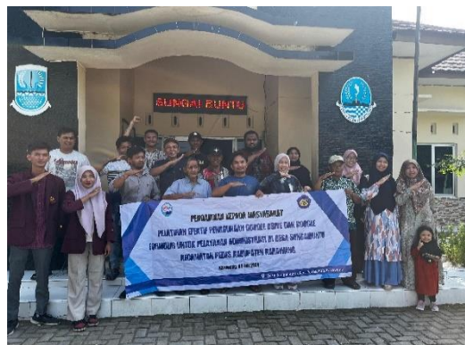
Gambar 4. Pelatihan Penggunaan Google Drive dan Google Form

Peserta menunjukkan antusiasme yang tinggi selama pelatihan penggunaan Google Form dan Google Drive. Mereka berharap pelatihan serupa dapat diadakan secara rutin di desa, sehingga staf kantor desa dapat terus meningkatkan pengetahuan dan keterampilan mereka. Pengetahuan baru ini diharapkan bermanfaat dalam meningkatkan kualitas pelayanan administrasi di Desa Sungaibuntu. Berikut adalah dokumentasinya, Gambar 4.