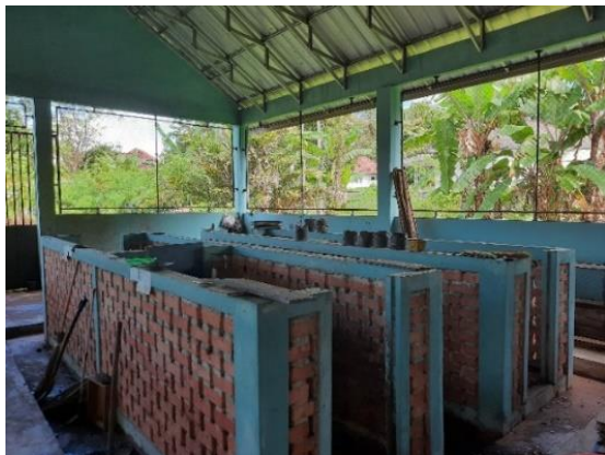
Gambar 2. Tempat produksi pupuk kompos

Berdasarkan gambar 1 dan 2, dapat diamati bahwa KSM Srinenanti Jaya telah memiliki tempat untuk memproduksi pupuk kompos, bahan baku yang dibutuhkan yaitu limbah rumah tangga. Bahan baku diperoleh dengan mengangkut sampah yang ada di kawasan pemukiman masyarakat. Se jauh ini produksi pupuk kompos masih sederhana yaitu dengan memilah dan menghaluskan sampah kemudian mengkomposkannya sehingga menjadi pupuk kompos padat.