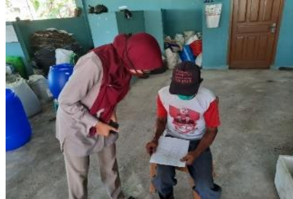
Gambar 3. Pembagian materi dan pengisian kuesioner oleh mitra