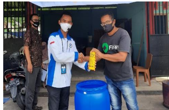
Gambar 4. Pembagian alat produksi pupuk organik cair dan stimulator EM4

Pada gambar 3 dan 4 dapat dilihat beberapa rangkaian kegiatan yang dilakukan yaitu pembagian dan penjelasan singkat tentang materi pupuk organik cair. Proses pembuatan pupuk cair yang disampaikan mengikuti tahapan yang telah dilakukan oleh (Rahmah dkk, 2014) yaitu :