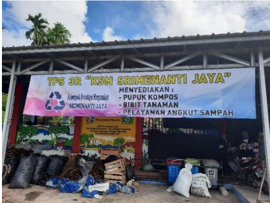
Gambar 1. Lokasi KSM Srinenanti Jaya