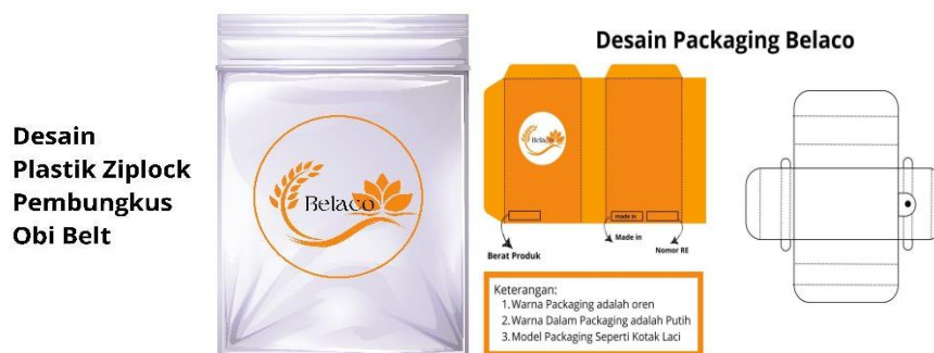
Gambar 3. Desain Kemasan Belaco

Amat dan Ishak dalam Robiani et al (2024) mengemukakan bahwa produk lebih dapat menarik minat konsumen jika disajikan dengan desain yang menarik dan kreatif yang dapat meningkatkan efektivitas pemasaran. Pengembangan kemasan produk ekspor Belaco adalah langkah penting agar produk tampil menarik dan meningkatkan daya saing di pasar internasional. Widiati (2020) menyatakan bahwa desain kemasan perlu disesuaikan dengan jenis produk yang dikemas, sasaran pasar yang ingin dijangkau, dan harus mencerminkan tren yang sedang berkembang.