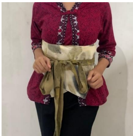
Gambar 1. Obi Belt Ecoprint Belaco

Hasil observasi yang disajikan pada tabel 3 menunjukkan beberapa aspek penting terkait produk obi belt ecoprint. Produk ini memiliki desain yang unik dan menarik karena penggunaan teknik ecoprint, yang tidak hanya memberikan keindahan visual tetapi juga menciptakan karakteristik yang berbeda pada setiap produk. Warna yang dihasilkan dari proses ecoprint didominasi oleh tone earthy, yang memberikan kesan alami dan ramah lingkungan. Keunikan desain ini menjadi salah satu alasan utama yang menarik perhatian konsumen yang mencari produk fashion yang tidak hanya fungsional tetapi juga estetis.