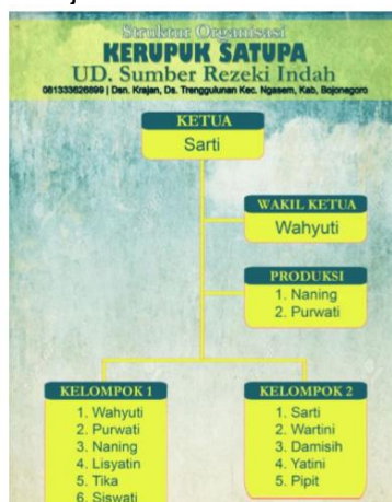
Gambar 5 : Struktur Organisasi