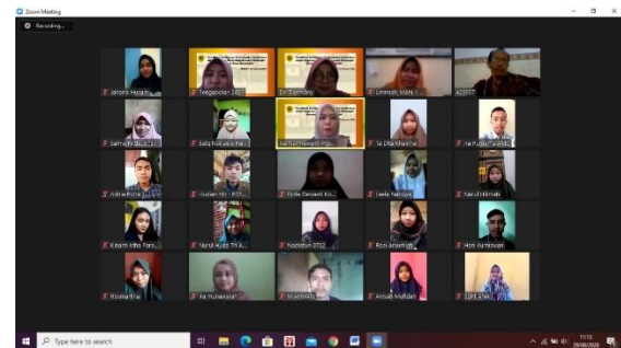
Gambar 3. Kegiatan Webinar Pengabdian

Para peserta sangat antusias dalam mengikuti kegiatan sosialisasi ini. Hal ini dibuktikan dari keikutsertaan peserta mulai dari awal sampai akhir tercatat hanya ada dua peserta yang meninggalkan kegiatan. Pada awal kegiatan ada 60 peserta dan di akhir kegiatan ada 58 peserta. Pada sesi penyampaian materi antusias peserta juga terlihat dari keaktifan peserta memberikan pertanyaan pada kolom chat setelah materi disampaikan pada masing-masing sesi materi.