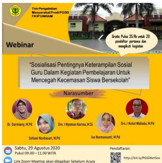
Gambar 1. Flyer Webinar Pengabdian

Kegiatan Pengabdian Masyarakat yaitu “Sosialisasi Pentingnya Keterampilan Sosial Guru Dalam Kegiatan Pembelajaran Untuk Mencegah Kecemasan Siswa Bersekolah” dilaksanakan sesuai dengan apa yang direncanakan. Meskipun ada beberapa hal yang berubah dari perencanaan semula disebabkan karena pandemi Covid-19. Perubahan yang terjadi yaitu teknis pelaksanaan yang semula direncanakan secara tatap muka menjadi dilaksanakan secara daring.