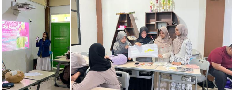
Gambar 2. Dokumentasi Kegiatan Pengabdian Kepada Masyarakat pada Sekolah Asrama Ar Raihan: presentasi materi dan Forum Group Discussion (FGD).

Selain itu, kegiatan ini dinilai efektif dan relevan dalam meningkatkan pemahaman remaja mengenai perawatan kulit berjerawat. Hal ini berkaitan dengan karakteristik peserta yang merupakan anak asrama dengan jadwal yang padat, sehingga kegiatan pengabdian kepada masyarakat ini dapat membantu mereka meningkatkan pemahaman serta kemampuan dalam melakukan tatalaksana jerawat dengan lebih baik. Dokumentasi Kegiatan dapat dilihat pada gambar berikut.