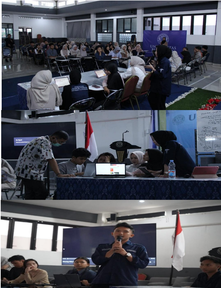
Gambar 4. Diskusi kelompok mahasiswa dalam pelatihan edukasi budaya anti-korupsi berbasis pembelajaran partisipatif.

Sebagaimana ditunjukkan pada Gambar 4, keterlibatan aktif mahasiswa dalam diskusi kelompok menjadi indikator penting keberhasilan pendekatan yang digunakan. Dinamika dialog yang terbentuk tidak hanya mendorong keberanian mahasiswa dalam mengemukakan pendapat, tetapi juga memfasilitasi proses refleksi etis melalui konfrontasi ide, pengalaman, dan nilai personal. Proses ini berkontribusi langsung terhadap peningkatan sikap akuntabilitas mahasiswa, khususnya pada aspek transparansi dan keberanian melapor, sebagaimana tercermin dalam hasil post-test. Dengan demikian, diskusi kelompok berfungsi sebagai medium transformasi nilai yang menjembatani pemahaman kognitif dengan kesadaran moral dan komitmen perilaku etis, sekaligus menegaskan efektivitas pembelajaran partisipatif dalam konteks edukasi budaya anti-korupsi di lingkungan perguruan tinggi.