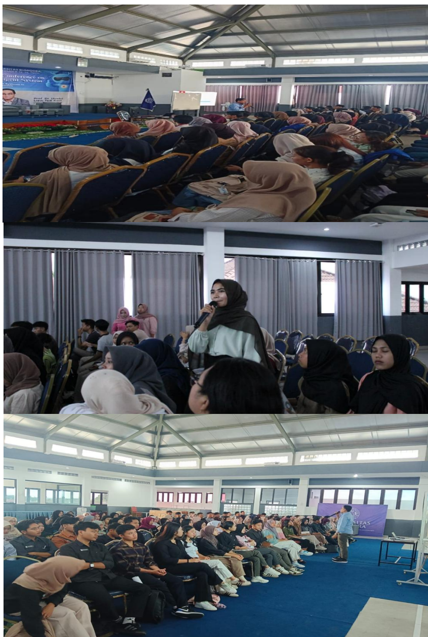
Gambar 3. Dokumentasi Pelaksanaan Pelatihan Edukasi Budaya Anti-Korupsi Berbasis Partisipatif

Gambar 3 tersebut menampilkan suasana pelaksanaan pelatihan yang berlangsung secara partisipatif dan kolaboratif, ditandai dengan keterlibatan aktif mahasiswa dalam setiap sesi kegiatan. Interaksi antara fasilitator dan peserta berlangsung secara dialogis, mencerminkan terciptanya ruang belajar yang inklusif dan reflektif. Kondisi ini memungkinkan mahasiswa untuk mengemukakan pandangan kritis, mengajukan pertanyaan, serta merefleksikan dilema etis yang muncul dalam berbagai studi kasus yang dibahas. Dokumentasi ini sekaligus menunjukkan bahwa pelatihan tidak bersifat satu arah, melainkan berorientasi pada pembentukan kesadaran kolektif dan internalisasi nilai akuntabilitas. Dengan demikian, pelaksanaan kegiatan sebagaimana tergambar memperkuat tujuan program pengabdian, yakni menumbuhkan budaya integritas dan sikap anti-korupsi yang berkelanjutan di lingkungan perguruan tinggi.