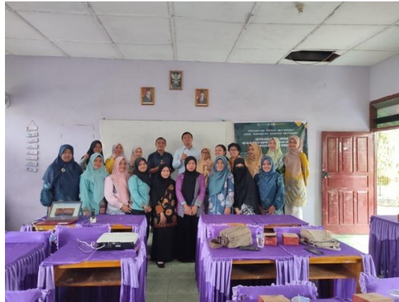
Gambar 3. Tim Pelaksana Berfoto Bersama Para Guru.