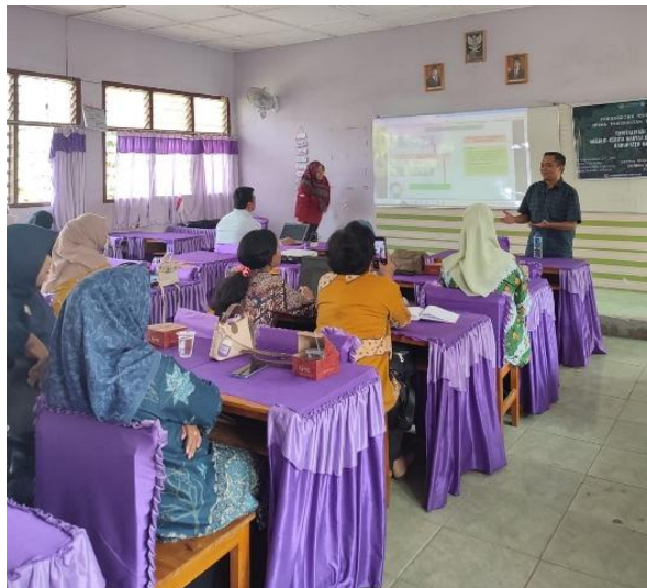
Gambar 1. Penyampaian Materi Pentingnya Revitalisasi Bahasa Daerah Melalui Cerita Rakyat

Kegiatan ini dilaksanakan pada tanggal 9 Oktober 2025 bertempat di ruang pertemuan SMP Negeri 2 Kecamatan Lawang Kidul, Kabupaten Muara Enim, Sumatera Selatan. Kegiatan ini dihadiri oleh para guru dari berbagai SMP di wilayah Kecamatan Lawang Kidul serta perwakilan dari pihak sekolah dan tim pelaksana dari FISIP Unsri. Rangkaian kegiatan diawali dengan registrasi dan absensi peserta. Para guru yang hadir mengisi daftar hadir sebelum mengikuti sosialisasi. Setelah semua peserta hadir, kegiatan dibuka secara resmi oleh perwakilan sekolah yang menyampaikan ucapan selamat datang dan harapan agar kegiatan ini dapat memberikan manfaat bagi peningkatan kesadaran pelestarian bahasa daerah di lingkungan sekolah. Selanjutnya, tim pelaksana menyampaikan pengantar kegiatan dengan menjelaskan tujuan sosialisasi, yaitu untuk meningkatkan pemahaman guru tentang pentingnya revitalisasi bahasa daerah, khususnya melalui media cerita rakyat sebagai sarana pembelajaran yang kontekstual dan menarik bagi siswa.