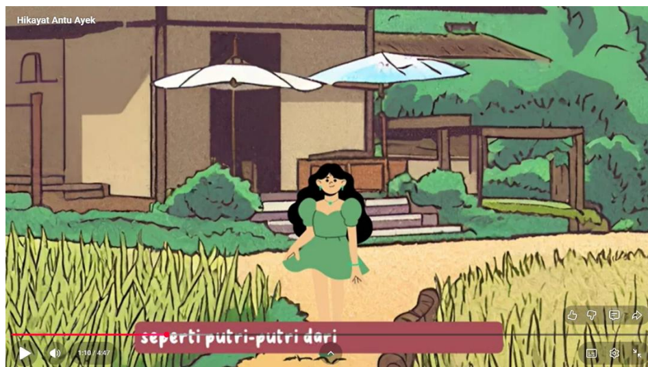
Gambar 2. Video Legenda Antu Ayek

Setelah penyampaian materi, kegiatan dilanjutkan dengan pemutaran video cerita rakyat lokal dari Sumatera Selatan yang videonya menggunakan bahasa lokal, seperti kisah Si Pahit Lidah dan Antu Ayek. Tayangan ini dimaksudkan untuk memberi gambaran konkret tentang bagaimana penggunaan bahasa daerah melalui cerita rakyat dapat digunakan sebagai media edukatif dan inspiratif untuk menumbuhkan kecintaan siswa terhadap bahasa dan budaya daerahnya.