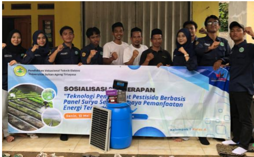
Gambar 3. Sesi Penyerahan Alat

Kegiatan pendampingan pemasangan alat sistem penyemprotan pestisida berbasis panel surya dilaksanakan di ladang milik kelompok tani Desa Cisalam, Kecamatan Baros, setelah kegiatan sosialisasi selesai dilaksanakan. Dalam kegiatan ini, para anggota kelompok tani terlibat langsung mulai dari proses penempatan panel surya di lokasi yang paling optimal untuk menangkap sinar matahari, hingga penyambungan sistem ke Solar Charge Controller (SCC), aki 12V, dan pompa DC. Selanjutnya, dilakukan instalasi jaringan selang dan sprinkler yang berfungsi menyemprotkan cairan pestisida secara merata ke area tanaman. Pendampingan dilakukan secara praktis dan bertahap agar kelompok tani memahami sistem kerja serta alur distribusi daya dan cairan pestisida. Kegiatan ini tidak hanya bertujuan untuk memperkenalkan teknologi pertanian berbasis energi terbarukan, tetapi juga memberikan pengalaman langsung kepada petani agar mampu mengoperasikan dan merawat alat tersebut secara mandiri.