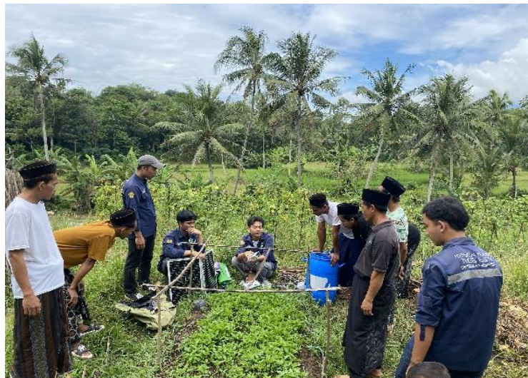
Gambar 4. Pendampingan Pemasangan Alat di Lapangan

Kegiatan pendampingan pemasangan alat sistem penyemprotan pestisida berbasis panel surya dilaksanakan di ladang milik kelompok tani Desa Cisalam, Kecamatan Baros, setelah kegiatan sosialisasi selesai dilaksanakan. Dalam kegiatan ini, para anggota kelompok tani terlibat langsung mulai dari proses penempatan panel surya di lokasi yang paling optimal untuk menangkap sinar matahari, hingga penyambungan sistem ke Solar Charge Controller (SCC), aki 12V, dan pompa DC. Selanjutnya, dilakukan instalasi jaringan selang dan sprinkler yang berfungsi menyemprotkan cairan pestisida secara merata ke area tanaman. Pendampingan dilakukan secara praktis dan bertahap agar kelompok tani memahami sistem kerja serta alur distribusi daya dan cairan pestisida. Kegiatan ini tidak hanya bertujuan untuk memperkenalkan teknologi pertanian berbasis energi terbarukan, tetapi juga memberikan pengalaman langsung kepada petani agar mampu mengoperasikan dan merawat alat tersebut secara mandiri.