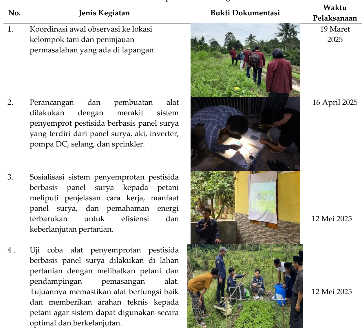
Tabel 1. Tahap Pelaksanaan Kegiatan