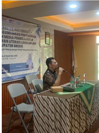
Gambar 1. Pemaparan materi pengembangan modul ajar matematika berbasis literasi lingkungan

Peserta diajak untuk memahami bagaimana isu lingkungan lokal—seperti pencemaran udara, limbah industri, dan kualitas lingkungan—dapat dijadikan konteks autentik untuk pembelajaran matematika, khususnya pada materi statistika, pengolahan data, dan pemodelan sederhana. Diskusi awal menunjukkan bahwa sebagian besar guru belum terbiasa memanfaatkan isu lingkungan sebagai konteks pembelajaran, meskipun isu tersebut sangat dekat dengan kehidupan siswa.