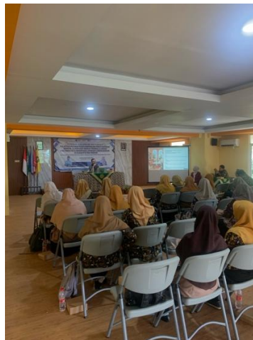
Gambar 2. Pelatihan penyusunan modul ajar berbasis literasi lingkungan

Sesi berikutnya difokuskan pada pemanfaatan data nyata sebagai sumber belajar. Peserta dibimbing secara bertahap untuk mengakses data resmi dari Badan Pusat Statistik (BPS) serta menelaah ringkasan hasil penelitian terkait kasus pencemaran lingkungan di Kabupaten Gresik. Guru dilatih memilih variabel data yang relevan, menyederhanakan data, serta mengubahnya menjadi tabel, grafik, dan pertanyaan matematis yang sesuai dengan tingkat kognitif siswa SMA. Melalui praktik ini, peserta mulai memahami bagaimana data lingkungan dapat diintegrasikan secara logis ke dalam aktivitas pembelajaran matematika.