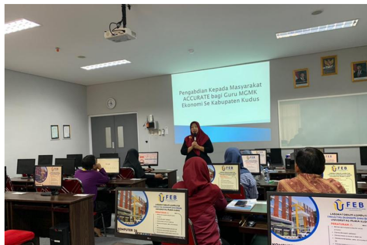
Gambar 1. Pemateri menjelaskan tentang aplikasi Accurate

Gambar 1 merupakan dokumentasi pelaksanaan kegiatan pelatihan.