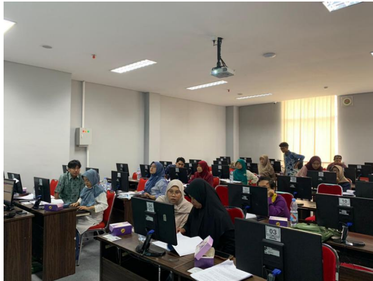
Gambar 2. Guru –guru MGMP Ekonomi SMA Se-Kabupaten Kudus simulasi menggunakan aplikasi Accurate