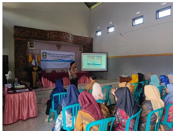
Gambar 3. Edukasi Materi Penerapan Self Management