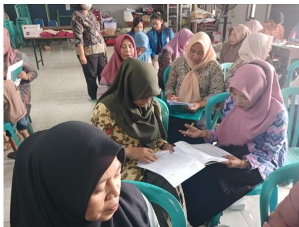
Gambar 4. Pelatihan Penerapan Self Management

Pemberdayaan kader kesehatan dalam penguatan kemampuan self management pada pelayanan Posyandu Desa Purwosekar