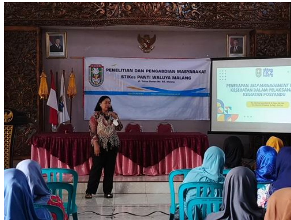
Gambar 2. Edukasi Materi Self Management

melampaui target yang ditetapkan yaitu sebanyak 90%. Keberhasilan ini menunjukkan bahwa para peserta sangat antusias dengan kegiatan PkM ini, hal ini dikarenakan materi yang diperoleh oleh peserta sangat relevan dengan kondisi di posyandu Desa Purwosekar yang sebagian besar kadernya belum pernah mengikuti kegiatan edukasi terkait self management . Selain itu peran dari perawat penanggungjawab cukup besar dalam membantu perijinan dan memotivasi para peserta untuk berperan aktif dalam kegiatan pengabdian kepada masyarakat ini.