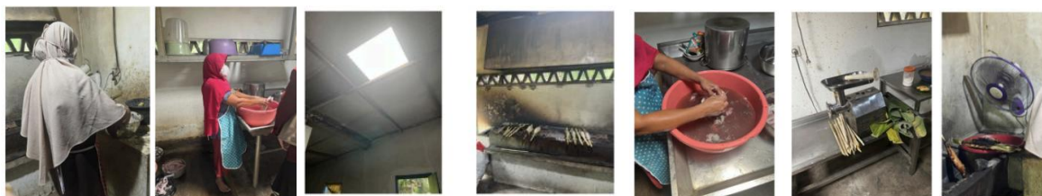
Gambar 1. Potensi Risiko Bahaya selama Proses Produksi

Hasil identifikasi bahaya menunjukkan bahwa lingkungan kerja produksi sate bandeng ini terpapar risiko yang meliputi faktor fisik, kimia, biologi, ergonomi, psikososial, dan keselamatan kerja. Pola ini konsisten dengan karakteristik sektor usaha kecil dan menengah, yang umumnya masih menggunakan proses manual, memiliki fasilitas teknis yang terbatas, dan belum menerapkan sistem manajemen K3 secara formal (Musungwa & Kowe, 2022).